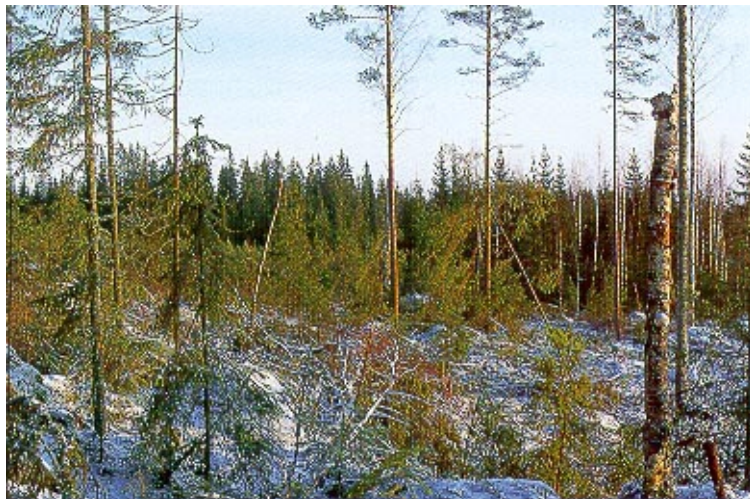
Kuva 4. Vuonna 1994 hakattu uudistusala, jossa on toteutettu uusia ohjeita jättämällä pötkkelöitä ja puuta luonnonrikastuttamiseksi.

hyvin tunnettuna, ja uhanalaisuustarkastelu on voinut tehdä verraten laajasta osasta lajistoa. Uhanalaisuusluokituksen mukaan lajit jaetaan häviämistodennäköisyyden perusteella neljään luokkaan: hävinneet, erittäin uhanalaiset, vaarantuneet ja silmälläpidettävät. Suomen Ympäristökeskus pitää yllä uhanalaisten lajien tietorekisteriä (UHEX), jonka tietosisällön kolme pääkohtaa ovat uhanalaiset lajit, niiden esiintymispaikat, sekä näitä koskevat havainnot. Suomessa on luokiteltu uhanalaisiksi lajeiksi kaikkiaan 1692 lajia. Tähän lukuun sisältyy myös silmälläpidettävät lajit, joita on 1029 (Metsätalastollinen vuosikirja 1995). Kaikista uhanalaisista lajeista noin 43 % elää metsissä ja noin 5 % soilla. Metsissä elävistä uhanalaisista lajeista noin 55 % vaatii elinympäristökseen lehtometsiä. Näin tarkasteltuna lakiesityksen ympäristölista kattaa hyvin luonnontilaisina harvinaisiksi käyvät kohteet, joissa metsien ja soiden uhanalaisia lajeja esiintyy.