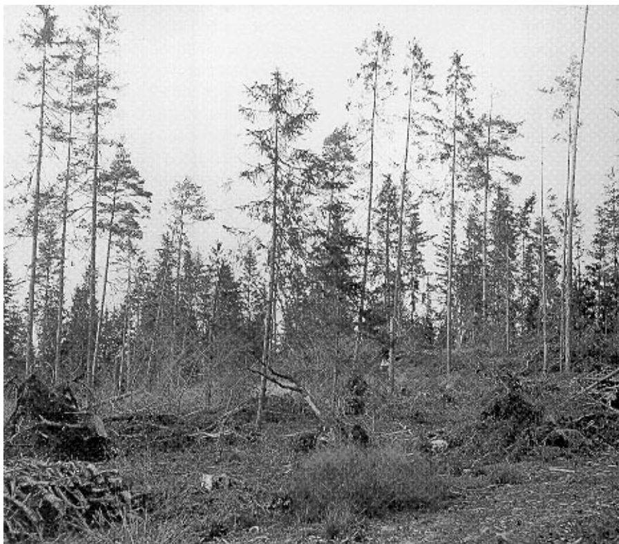
Kuva 5. Uusien metsänhoitosuosituksen mukaiset hakkuut vaativat ammattitaitoista ja huolellista toteuttamista, jotta tulos uuden puuston kasvattamisen kannalta ei ole samanlainen kuin aiemmat harsintatyyppiset hakkuut. Vertailuksi näkymä vuonna 1938 toteutetusta harsintakoealan hakkuusta puolukkatyyppin männikössä Satakunnasta.

Metsähallituksessa on kehitetty ns. alue-ekologista suunnittelua laajojen metsätalousalueiden monimuotoisuuden turvaamiseksi. Alue-ekologinen suunnitelma on kokonaistarkastelu, jossa kartoitetaan tietokonepohjaisen paikkatietojärjestelmän, ilmakuvien, karttojen ja paikallistuntemuksen avulla laajan metsäalueen arvokkaat luontokohteet. Luontokohteita yhdistetään ns. ekologisilla käytävillä ja askelkivillä, jotka voivat toimia eri lajien leviämis-