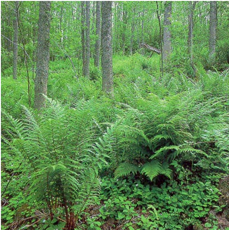
Kuva 1. Hamaaleppää kasvava rehevä lehto, jossa pintakasvillisuutena runsaasti saniaisia, metsätähtiä ja käenkaalia.

Joitakin kestävä metsätalouden piirteitä voidaan tarkastella ainoastaan politiikan välineiden ja niiden tehokkaan käytön kannalta. Näitä seurataan