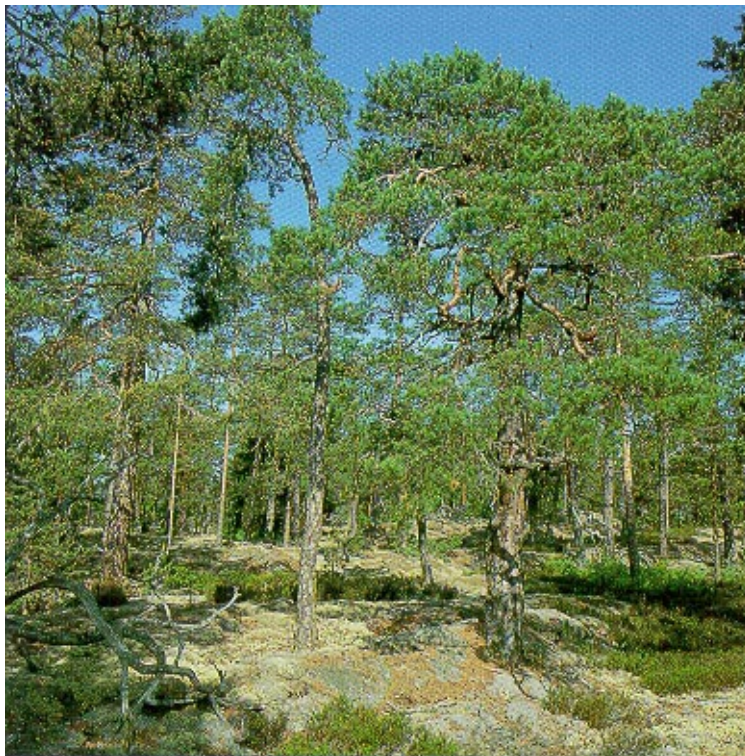
Kuva 3. Kitukasvuista kalliomännikköä, jossa laikuina avokalliota sekä jäkälä- ja varpukasvustoa. Kuva Metta Erkki Oksanen.

lo ja sisältää monipuolista tietoa varsinkin metsien terveydentilasta, metsien tuotteista, monimuotoisuudesta sekä metsien sosiaalisista ja taloudellisista toiminnoista ja kulttuuriarvoista. Ohjausryhmän hyväksymä indikaattoriluettelo on edelleen jatkotyön pohjana. Valtakunnallisen raportin laadintaa varten aloitetaan luettelon mukainen tietojen keruu.