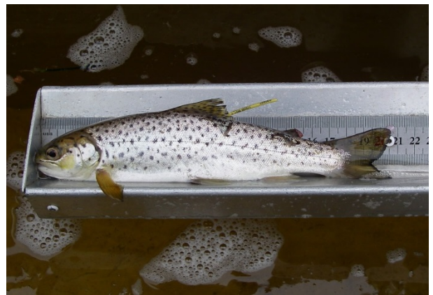
Kuva 1. a) Muuramenjoen ruuvi sijaitsi Alakosken alaosalla uoman poikkileikkauksen syvimässä kohdassa, jossa myös virrannopeus oli suurin. b) Läsäkosken ruuvi asennusvaiheessa Alakosken alaosalla lähellä jokisuuta kovimmassa virrassa. c) Ruuvipyödysten kalakammio tyhjennettiin haavilla. d) Ruuvipyödysten pyydystämät taimenet olivat väriltään hopeisia. Kuvan kala on merkitty ankkurimerkillä.

Läsäkoskella käytettiin Kala- ja vesitutkimus Oy:lta vuokrattua vastaavaa pyydystä, jonka rumpu oli halkaisijaltaan 183 senttimetriä. Pyydys asetettiin alimman kosken, Alakosken, loppuliukuun jokisuuhun kovimman virran ja syvimmän uoman kohdan kohdalle kiinnittämällä se rantapuihin neljällä köydellä (kuva 1b). Ruuvipyödyksien asennusvaiheessa pyyntiä tehtiin 8.5.2014 ja nostettiin ylös 29.5.2014. Pyydys pysyi toiminnassa koko 22 päivän pyyntijakson ajan. Saaliiksi saadut kalat lajiteltiin ja laskettiin sekä punnittiin tai vaihtoehtoisesti vain punnittiin riippuen kalamäärästä. Pyydys puhdistettiin ja kalapesä tyhjennettiin päivittäin. Särjet, salakat ja ahvenet kompostoitettiin ja muut kalat laskettiin takaisin jo-