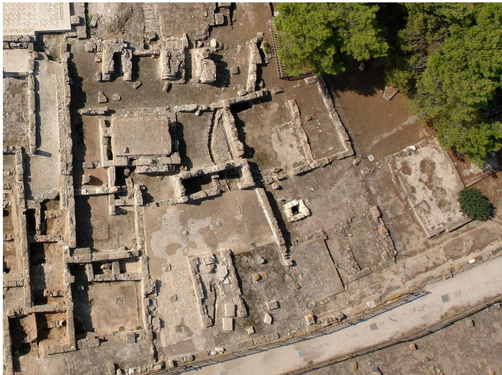
Fig. 3. Nora, l'area centrale. Domus repubblicane e, sulla destra, la domus L.

La Casa L, che si apriva verso Nord sulla via che univa il porto al foro, ha conservato sostanzialmente inalterati, schema generale ed aspetto della prima edificazione, e può essere considerata esemplare per posizione e per planimetria.