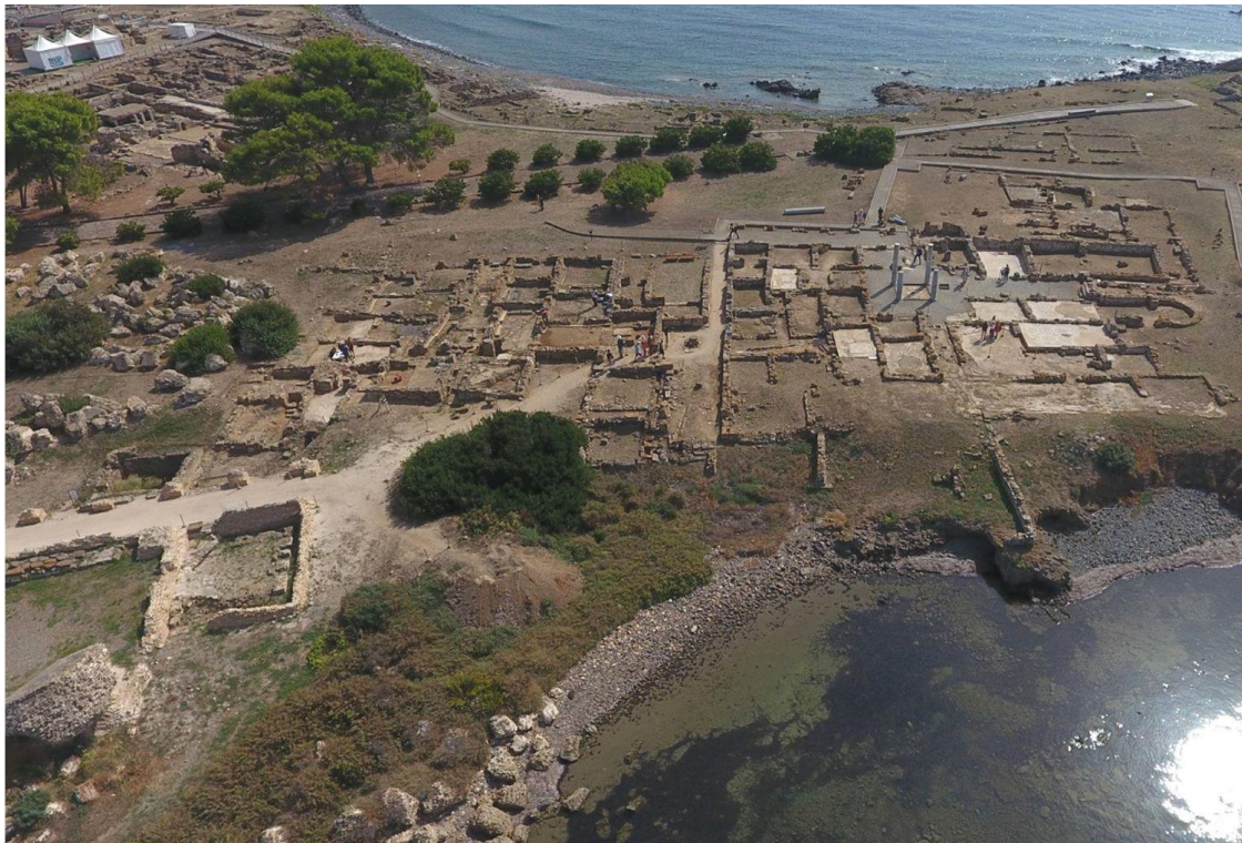
Fig. 2. Nora, l'area centrale. Le domus signorili.