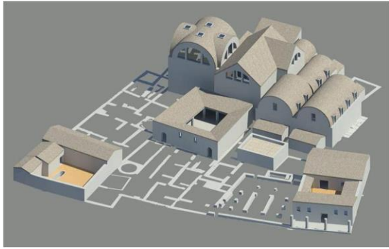
Fig. 4. Nora, l'area centrale. Ricostruzione 3D dei cortili delle domus mosaicate e, sulla destra, della casa L.