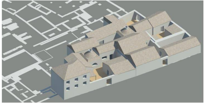
Fig. 5. Nora, l'area centrale. L'abitato di V secolo d.C. Ricostruzione 3D.

Lo sviluppo tipologico delle abitazioni individuato in questo isolato centrale è servito da parametro anche per un migliore inquadramento delle abitazioni dei due settori costieri, con la possibilità di agganciare sia stratigraficamente che cronologicamente i vari edifici.