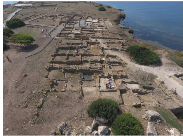
Fig. 7. Nora, l'area centrale. Le domus signorili.

Ancora più ad Est, altre domus hanno preso il nome dal pavimento a signinum che ornava uno degli ambienti, probabilmente un cubiculum , una stanza da letto, preceduta da un vestibolo. Questo era stato portato alla luce già negli anni '60, pur avulso dal contesto 11 , considerato testimonianza della fase dell'età repubblicana e poi augustea. L'area è ancora da scavare, ma appare collegata con la più meridionale delle case del settore delle Case a Mare, collegamento poi interrotto dalla costruzione della grande strada lastricata d'accesso all'edificio sacro della punta, detto di Eshmun, in anni vicini al 300 d.C.