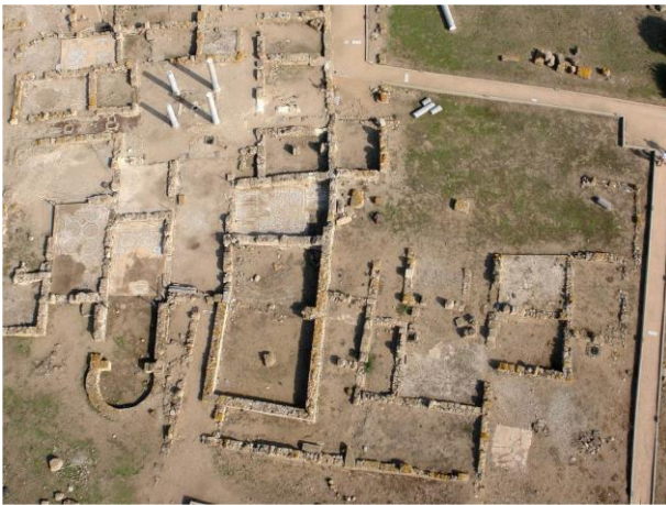
Fig. 6. Nora, l'area centrale. Domus dell'Atrio tetrastilo e domus del Thermopolium .

La piazzetta conclusa verso Ovest dal portico anteriore della Casa dell'Atrio Tetrastilo era delimitata verso Sud da un'altra domus con corte centrale, alla quale si accedeva attraverso lunghe fauces tra due ambienti: a quello ad Ovest si accedeva dalla corte, mentre quello più ad Est ne era separato, e si apriva invece verso la piazzetta. Sulla parete di fondo, le tracce del forno di un thermopolium , che venne in un secondo momento ampliato a tre forni: un segnale della vita quotidiana che in questa piazzetta si svolgeva 10 .