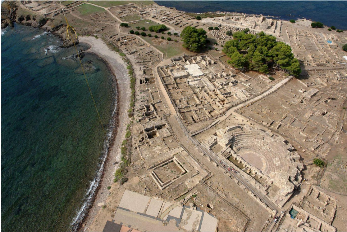
Fig. 1. Nora, l'area centrale. A sinistra la fascia delle Case a Mare, in alto le domus signorili.