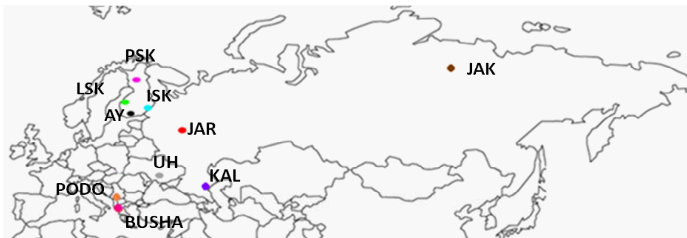
Kuva 1. Tutkimuksessa mukana olevien rotujen maantieteelliset sijainnit.

Naudan ja ihmisen yhteiselämä on jatkunut jo vajaat 10 000 vuotta. Nykynaudan esi-isän, sukupuuttoon kuolleen alkuhärän, kesytyskeskuksia katsotaan olleen kaksi, Lähi-idässä sekä nykyisen Pakistanin alueella. Eurooppalainen nauta, Bos taurus , on lähtöisin Lähi-idästä, kun taas kyttyrällinen Bos indicus Pakistanin seuduilta.