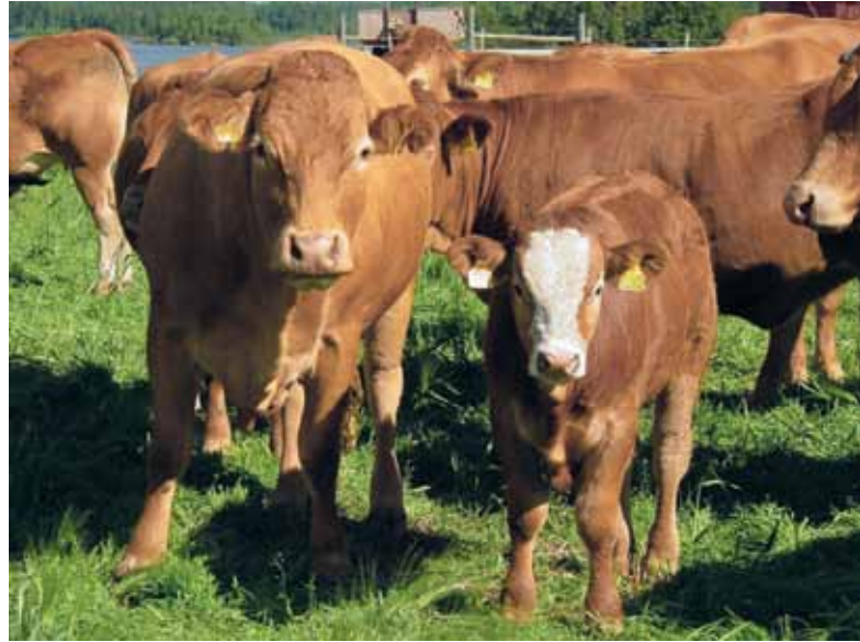
Limousinen käyttö liharotusiemennyksissä on perusteltua hyvän kasvutuloksen ja luokittumisen vuoksi.

Koska MAILI-hankkeessa toteutetun kasvatuskokeen perusteella rehujen syönnissä ei ole merkittäviä eroja rotuyhdistelmien välillä, saadut erot teurastilityksessä kuvaavat hyvin rotujen välistä taloudellista eroa loppukasvattajan kannalta.