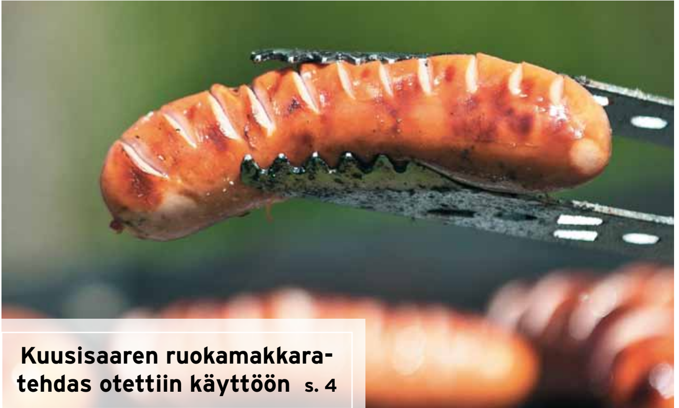
Kuusisaaren ruokamakkara- tehdas otettiin käyttöön s. 4