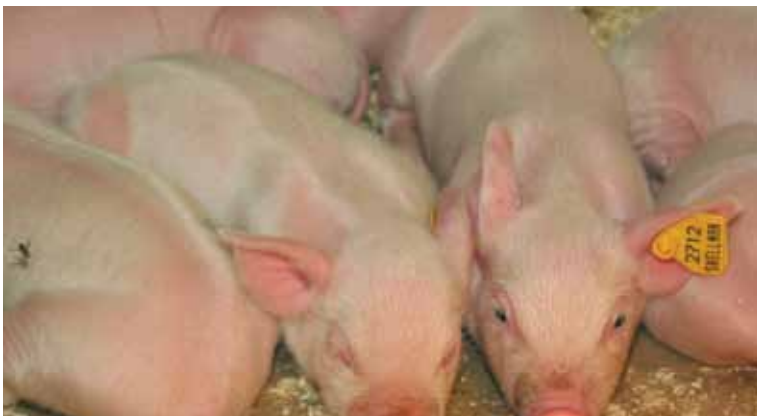
Sikojen ruokintaa kehitetään s. 12