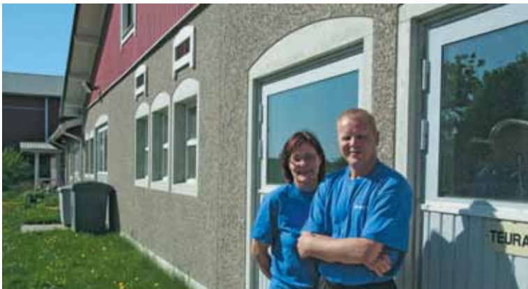
Ylä-Savossa tapahtuu! s. 8-10