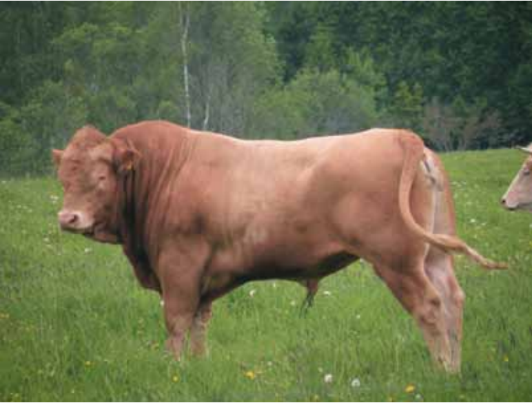
Blonde d'Aquitaine sopii erinomaisesti käytettäväksi maitotilojen liharotusiemennyksissä

Limousin on tällä hetkellä eniten käytetty rotu maitotilojen liharotusiemennyksissä. Aineiston liharotusiemennyksistä 43 prosenttia oli limousin-risteytyksiä. Seuraavaksi eniten oli käytetty aberdeen angus (19 %) ja blonde d'Aquitaine (13 %) rotuja. Charolais- ja simmental-risteytyksiä oli noin 10 prosenttia liharotusiemennyksistä ja herefordeja 6 prosenttia.