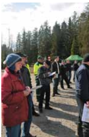
Suomen ensimmäinen limousin-huutokauppa keräsi paljon kiinnostuneita.