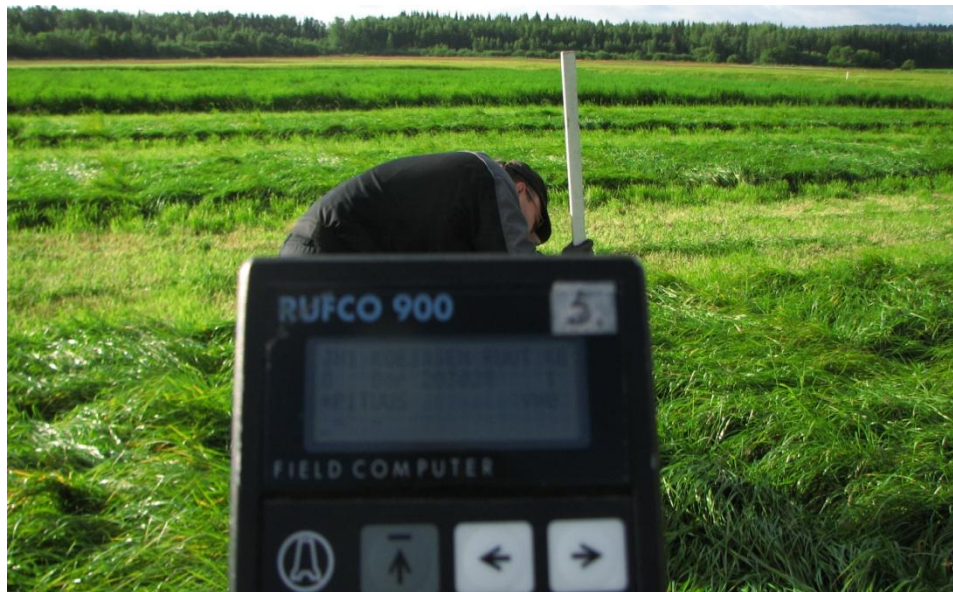
Kuva 1. Tiedonkeruulaitteeksi valittiin Rufco 900 -kenttätietokone

Mikrotietokoneiden alkaessa yleistyä 1990-luvun alussa kenttäkoetekni- nen toimikunta päätti selvittää kenttäkokeiden tiedonkeruuta kannettavien keruulaitteiden avulla. Tutkimusjohtaja asetti 14.3.1991 tiedonkeruuta sel- vittelevän projektin, nimeltään TIKE. Marraskuussa 1991 valmistui ra- potti, jonka pohjalta työryhmä kehitti vuonna 1992 Rufco- käsitietokoneisiin (Kuva 1) perustuvan kenttäkokeiden tiedonkeruu- ja tie- donhallintajärjestelmän (Mattila, I. ym. 1991 ja Mattila, I. 1993). Vajus Micro Oy Oulusta toimitti laitteet ja vastasi suurelta osin ohjelmoinnista yhdessä TIKE- työryhmän kanssa.