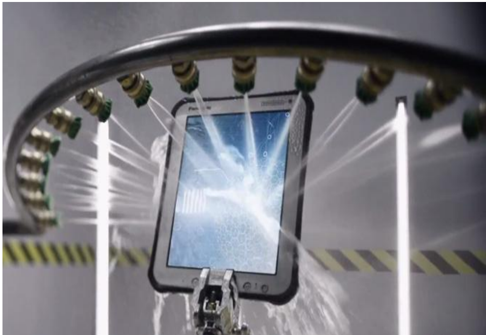
Kuva 4. Panasonic Toughpad FZ-A1 painevesitestissä (Panasonic Finland. 2012).

Tarkasteluhetkellä suojattujen ja soveltuvien tiedonkeruulaitteiden hintahaarukka alkoi noin 700 eurosta nousten useaan tuhanteen merkistä ja suojaustasosta riippuen. Kuvien laitteiden hinnat olivat noin tuhat euroa tarkasteluhetkellä.