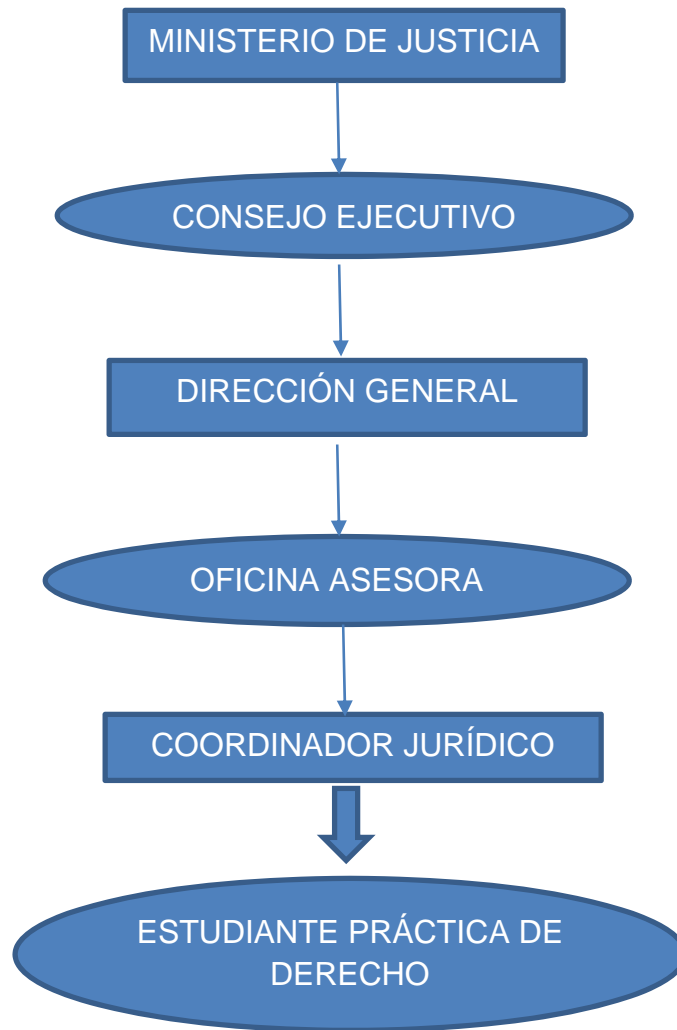
Figura 2. Posición jerárquica del estudiante

Dentro de la estructura organizacional del INPEC. El cargo de estudiante en práctica se encuentra ubicado de la siguiente manera: