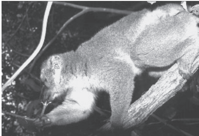
Figure 2.- Les makis ( Eulemur fulvus mayottensis ) introduits en 1997 sur l'îlot Mbouzi, consommaient, en novembre 2000, les nouvelles tiges de Dioscorea sansibarens.

Pour favoriser cette évolution, il a été décidé de restaurer la végétation sur une colline proche du refuge, où des cultures abandonnées avaient laissé un paysage dévasté. Ainsi, les services de la Direction de l'Agriculture et de la Forêt ont planté des espèces locales utiles aux lémurs, notamment le tamarinier ( Tamarindus indica ) et le manguiier ( Mangifera indica ). Cependant, lorsque les fruits ont une valeur commerciale, ils attirent des « cueilleurs » venus en pirogue ; et le braconnage (tenrecs, roussettes et parfois lémuriens) demeure également un problème important. C'est pourquoi, avant de programmer une diminution progressive du nourrissage d'appoint des lémuriens, et si possible une suppression totale, il est obligatoire d'organiser un gardiennage efficace et permanent, ainsi que des campagnes de sensibilisation (deux activités complémentaires pour tout projet de conservation).