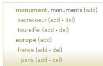
FIG. 2 – Boîtes affichant les tags structurés

L'interface simplifiée affiche les tags de manière arborescente selon la relation d'inclusion et affichant les uns à côté des autres les tags reliés par une relation de synonymie. L'illustration est un menu apparaissant sur le côté droit de la page dès que des relations structurées impliquent les tags recherchées (comme la boîte « recent tags » de la figure 1). Cela signifie que l'utilisateur peut modifier les relations entre les tags à partir de la même page où les signets impliqués par ces tags apparaissent sur le côté gauche. Ceci nous semble important pour faciliter une amélioration progressive des structures de tags. Entre parenthèses se trouvent les commandes permettant d'ajouter (add) ou d'effacer une relation (del).