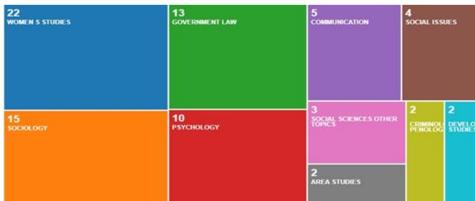
Figura 2. Áreas temáticas de los artículos seleccionados en la base de datos Web of Science.

Las principales áreas de investigación de los trabajos seleccionados fueron: Women Studies, seguida de Sociology, Government Law y Psychology (véase figura 1). El artículo más antiguo que arrojó la búsqueda en las combinaciones de palabras mencionadas se publicó en 1994 y el más reciente en el mismo año de la búsqueda, 2020 (véase figura 2).