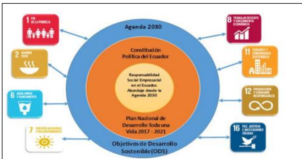
Figura1. Proyecto Ecuador 2030