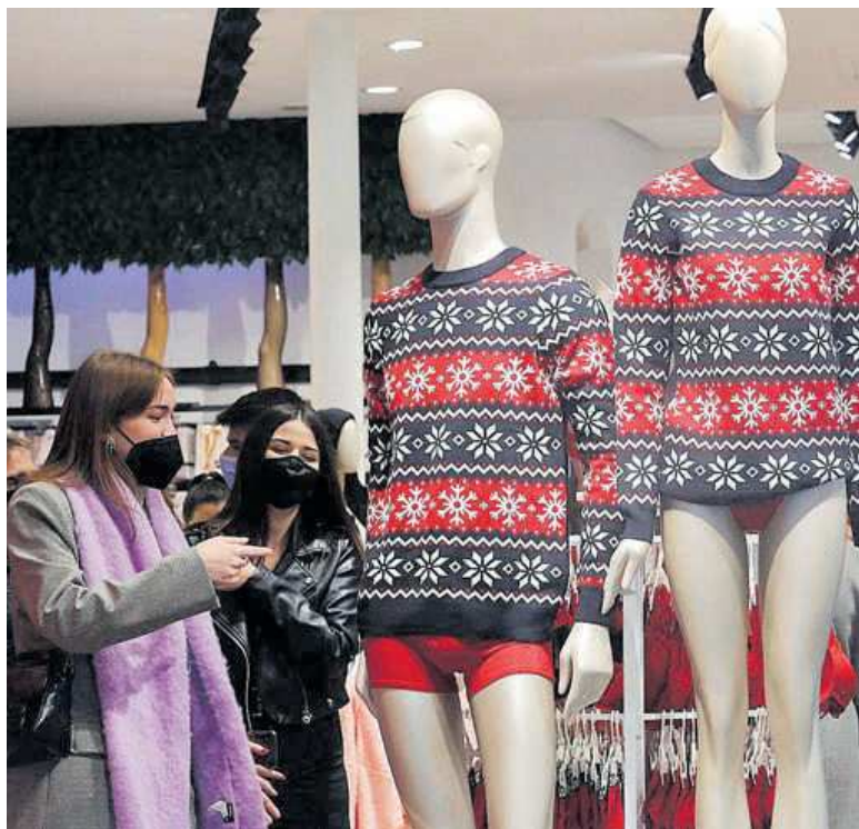
ESTRUCTURA PRODUCTIVA EL COMERCIO HA INCIDIDO EN LA VULNERABILIDAD DEL SECTOR SERVICIOS

El análisis de los datos de afiliación a la Seguridad Social desagregados por ramas de actividad nos permite analizar con más detenimiento la heterogeneidad de la