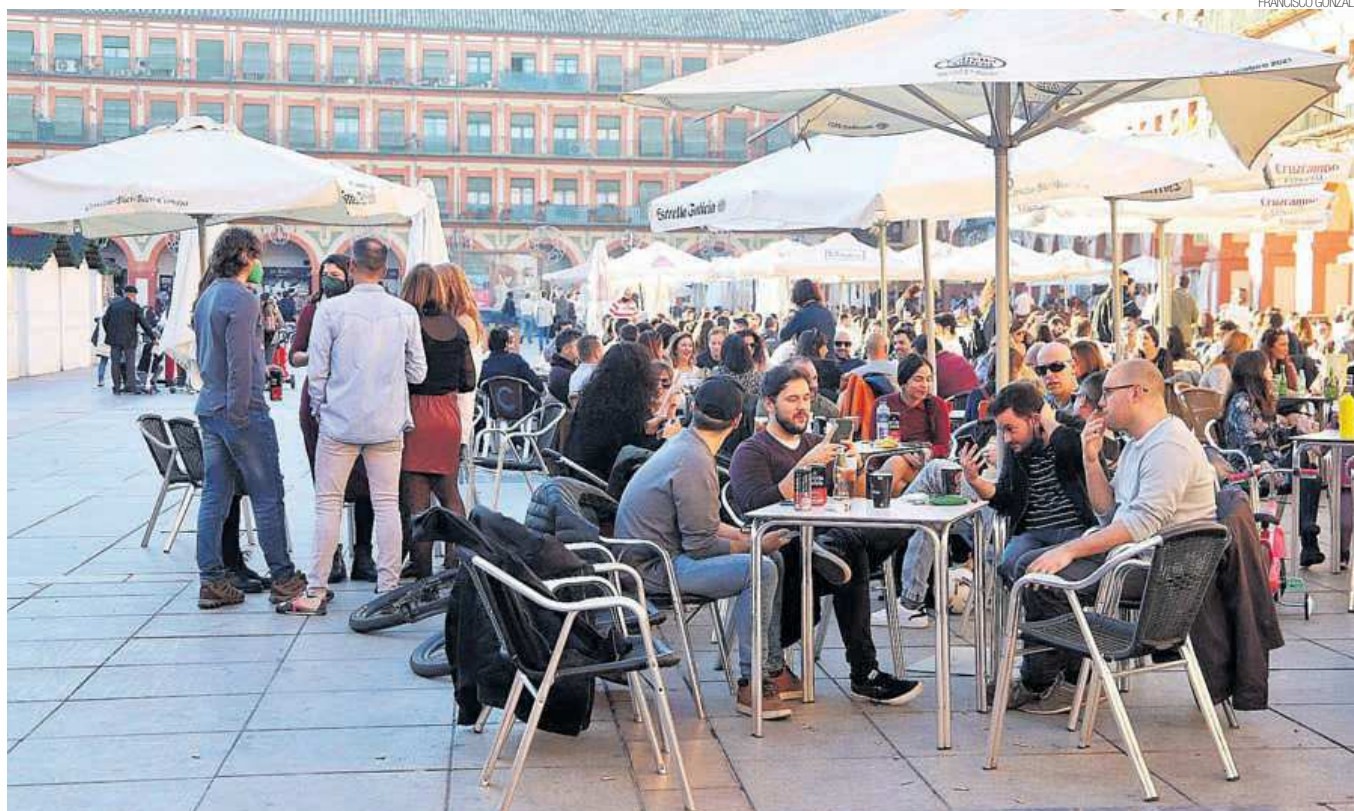
EL SECTOR MÁS DAÑADO LA HOSTELERÍA FUE LA RAMA DE ACTIVIDAD QUE EN EL AÑO 2021 PERDIÓ MÁS AFILIACIÓN CON RESPECTO A DICIEMBRE DEL 2019.