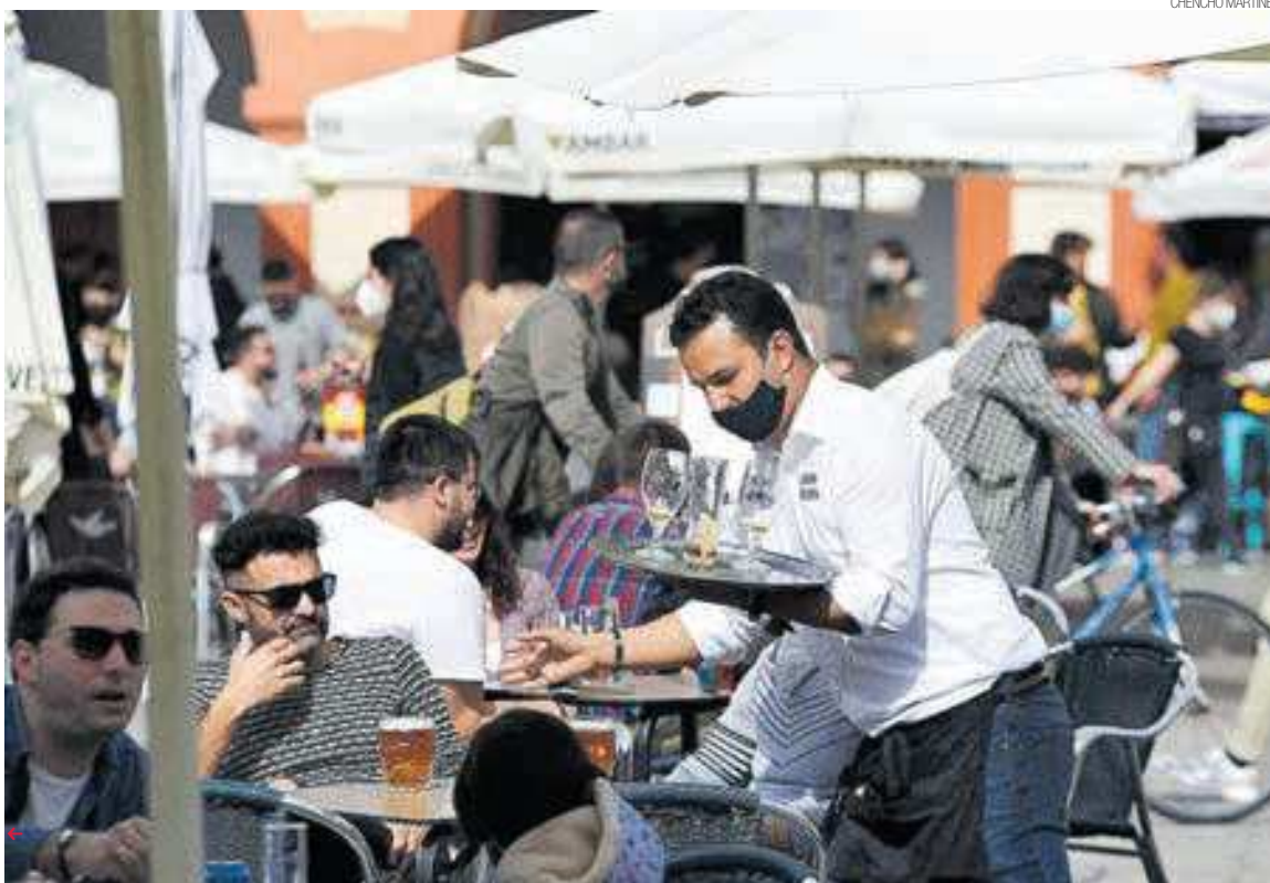
IMAGEN POCO FRECUENTE EN EL 2020 TERRAZA ANIMADA EN LA CORREDERA, EN UNO DE LOS POCOS PERIODOS CON RESTRICCIONES MODERADAS PARA LA HOSTELERÍA.

EN GENERAL, BAJÓ EL NÚMERO DE EMPRESAS CONCURSADAS, PERO SE DISPARÓ EN HOSTELERÍA (20%) Y SUBIÓ EN LA CONSTRUCCIÓN (2,27%)