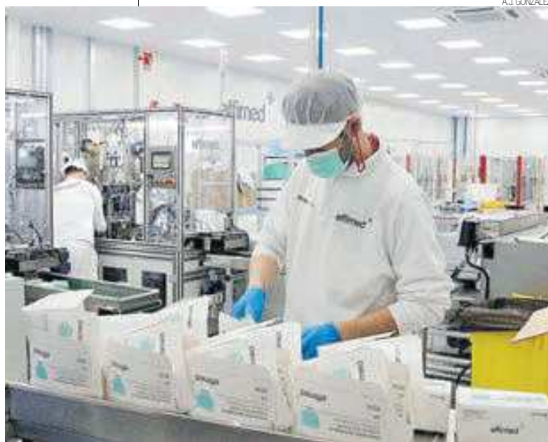
FABRICANDO MASCARILLAS EN LUCENA UNA IMAGEN DE LAS INSTALACIONES DE LA LUCENTINA EFFIMED, DE ONNERA GROUP.

En cuanto a los ingresos procedentes del IVA, el comportamiento de Córdoba ha sido similar al de la media andaluza, con una caída del 10,2%, sólo un 0,1 más que la media andaluza. A nivel nacional la caída de los ingresos por IVA ha sido del 12,1%. En cuanto a los impuestos