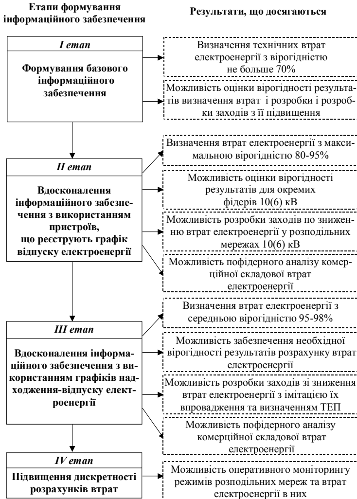
Рисунок 2 – Етапи формування інформаційного забезпечення задачі розрахунку втрат електроенергії в ЕМ Натурний експеримент з визначення балансових втрат. Для

опитування пристроїв телевимірювань дозволяє перейти від періодичних розрахунків втрат електроенергії в ЕМ до оперативного моніторингу режимів розподільних мереж та втрат у них.