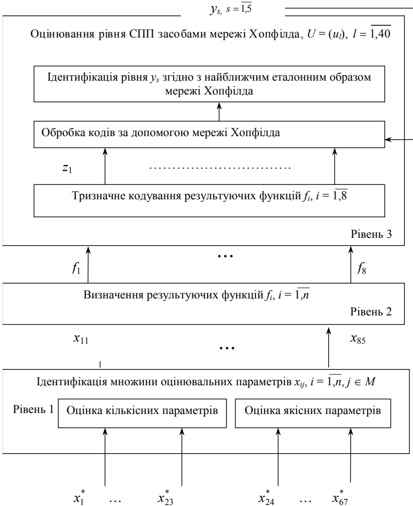
Рис. 2. Структурна модель оцінювання рівня використання СПП на базі нейронної мережі Хопфілда

Отже, автори пропонують визначити рівень використання СПП за допомогою кодів — z_l значень функцій f_i, i = \overline{1, n} на базі нейронної мережі Хопфілда. Для цього розроблена відповідна структурна модель процесу оцінювання рівня використання СПП, основний блок у якій розглядається як нейронна мережа Хопфілда (рис. 2) [3]. Розроблена структурна модель процесу оцінювання рівня використання СПП (рис. 2) складається з 3 рівнів.