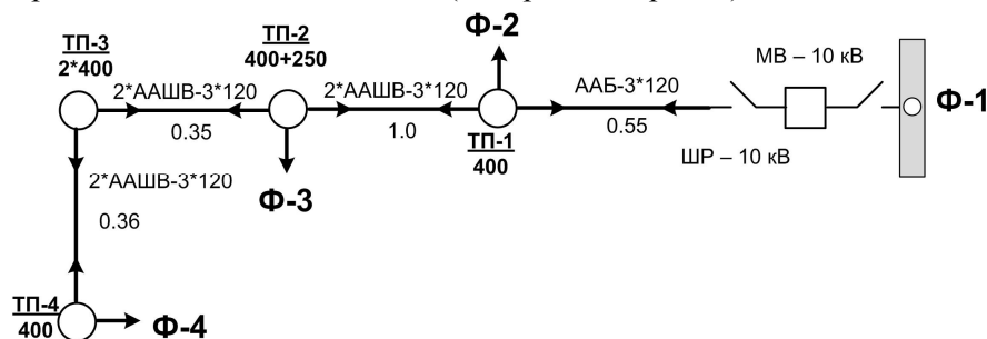
Рис. 1. Приклад схеми для аналізу варіантів живлення споживачів

За базове значення приймається значення якості функціонування "ідеальної", з огляду надійності та якості електричної енергії, розподільної мережі. Отриманий таким чином критерій дозволяє оцінювати зміну якості функціонування розподільної мережі і на його основі виконувати аналіз можливих варіантів живлення споживачів (див. рис. 1 та рис. 2).