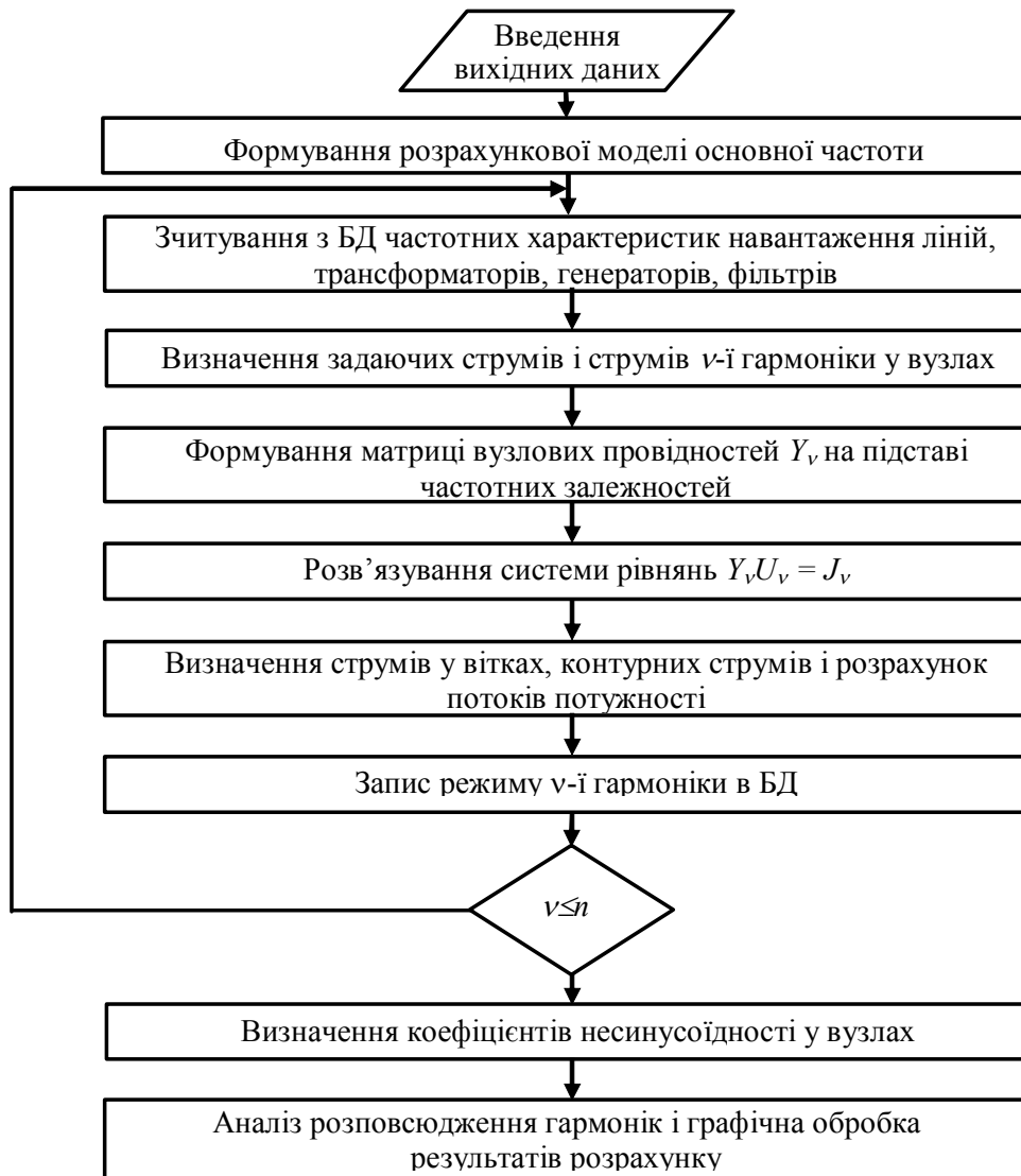
Рис. 2. Алгоритм дослідження розповсюдження гармонік

За умови, що в настроєному на k -ну гармоніку фільтрі kX_L = X_C/k , потужності фільтра на v -й гармоніці визначаються: