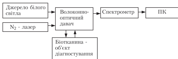
Рис. 2. Схема засобу вимірювання параметрів кольору біотканини шкіри в умовах in vivo розрахунковим методом на основі спектральних характеристик дифузного відбивання

При вимірюванні спектрів дифузного відбивання шкіри у якості джерела випромінювання білого світла використовуються галогенова лампа (ОВС-1, 200 Вт) і ксенонова дугова лампа (МТ-225, 250 Вт). Джерело збудження флуоресценції (лазер ЛГІ-505) використовувався при дослідженнях флуоресценції біотканин. Реєстрація спектрів відбивання та спектрів автофлуоресценції шкіри в умовах in vivo забезпечувалося за допомогою розроблених волоконно-оптичних давачів, які забезпечували підведення збуджуючого випромінювання до досліджуваного об'єкта і приймання відбитого біотканиною випромінювання [2, 3].