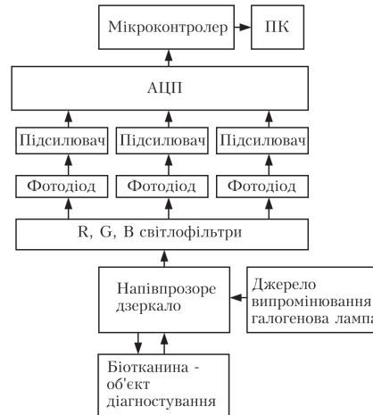
Рис. 4. Колориметр з трьома каналами фотоприймачів та одним джерелом випромінювання