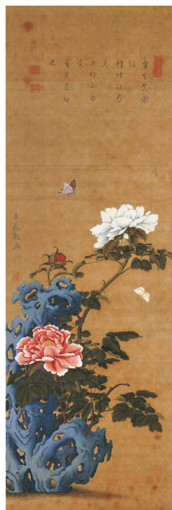
【図20】佐竹曙山筆「岩に牡丹図」(秋田市立千秋美術館蔵)