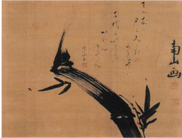
【図11】島津重豪筆・佐竹曙山賛「墨竹図」(秋田市立千秋美術館蔵)