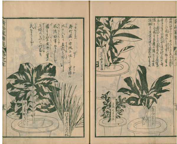
【図4】『草木奇品家雅見』