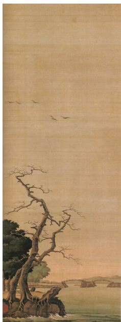
【図18】小田野直武筆「日本風景図」(照源寺蔵)