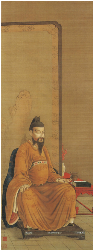
【図6】小田野直武筆「唐太宗花鳥図」のうち「唐太宗図」 (秋田県立近代美術館蔵)