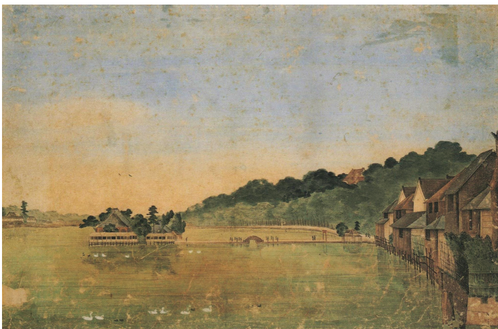
【図2】小田野直武筆「不忍池図(眼鏡絵)」(歸空庵コレクション) ※反転画像