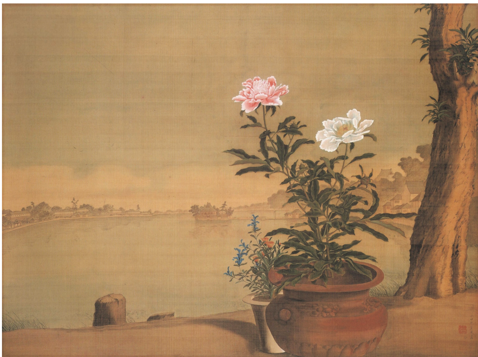
【図1】小田野直武筆「不忍池図」(秋田県立近代美術館蔵)