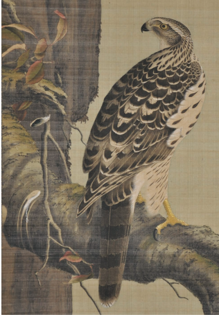
【図10】小田野直武筆「鷹図」