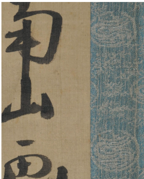
【図16】図11「墨竹図」表装部分