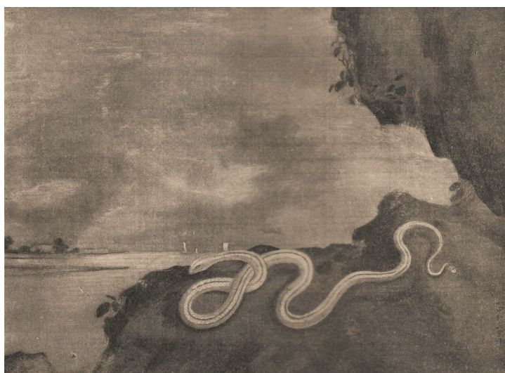
【図19】小田野直武筆「白蛇図」(『日本洋画曙光』所載)