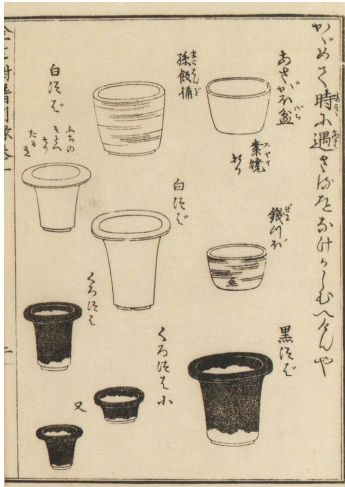
【図5】『金生樹譜・別録』