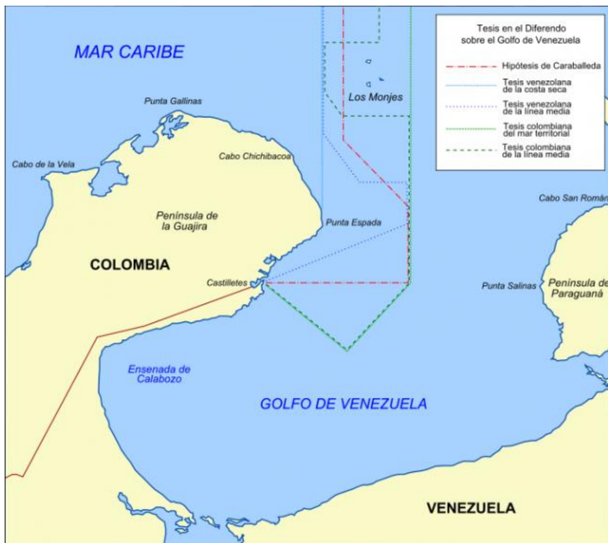
Figura 2. Diferendo del Golfo de Venezuela