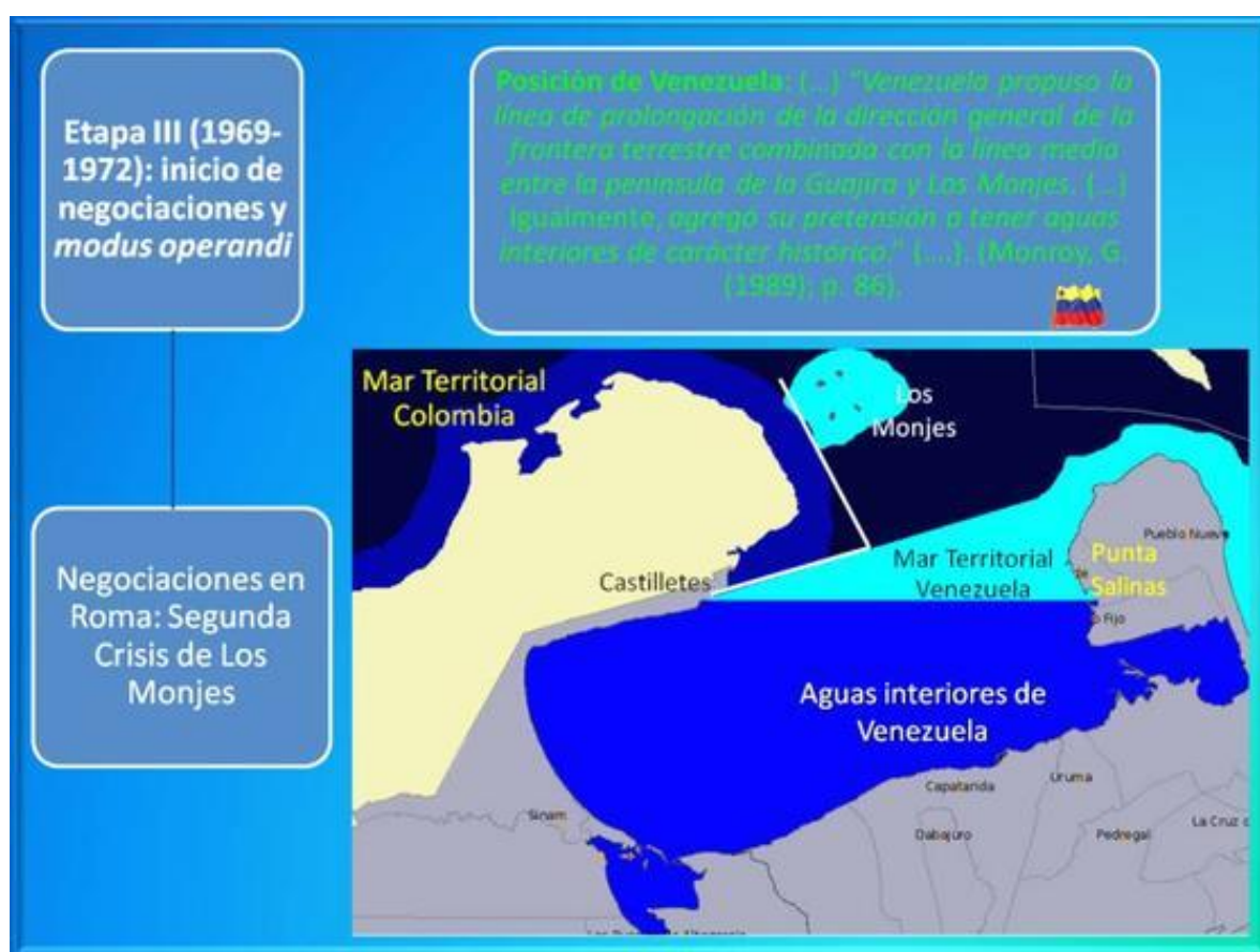
Figura 4. Posición de Venezuela

explotación económica exclusiva y el reconocimiento de los demás Estados. Con base en esta definición aceptada por la comunidad internacional Venezuela esgrime argumentos para demostrar que el golfo es una bahía histórica y por tanto sus aguas, históricas también son venezolanas, excluyendo cualquier posibilidad de pertenecer a Colombia. (Muñoz & Vásquez, 2014, p. 47).