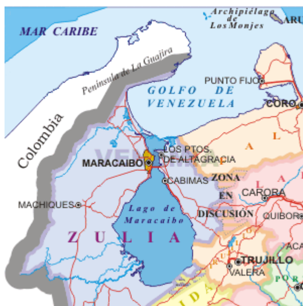
Figura 1. Ubicación del Golfo de Venezuela