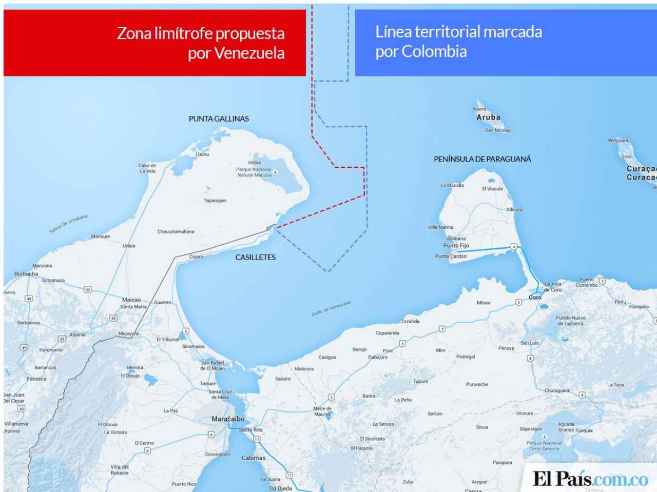
Figura 5. Zonas limítrofes propuestas por los dos países