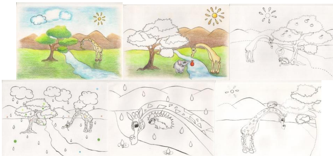
Рис. 2. Стимульный материал к методу совместного чтения текста и работой над иллюстрациями

Занятие 1. Ребенку предлагается прочитать первый фрагмент предложенного рассказа «Как Жираф сам себя наказал» (первые два абзаца). После этого ребенку предьявляется картинка, на которой проиллюстрировано прочитанное им ранее. Задание заключается в том, что ребенку необходимо обозначить на рисунке границы всех элементов. Данное задание направлено на развитие произвольного зрительного внимания и навыков зрительного анализа.