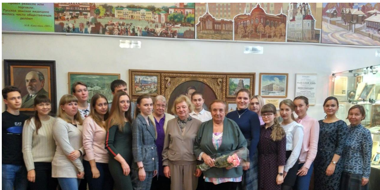
Рис.2. Заседание СНО кафедры на базе Областного музея истории медицины в 2018 году

Уникальным видом заседаний СНО кафедры факультетской педиатрии и пропедевтики детских болезней является организация ежегодного заседания студенческого научного общества на базе Областного музея истории медицины, где студенты педиатрического факультета встречаются с ветеранами педиатрической службы Урала, которые делятся своим бесценным клиническим и жизненным опытом.