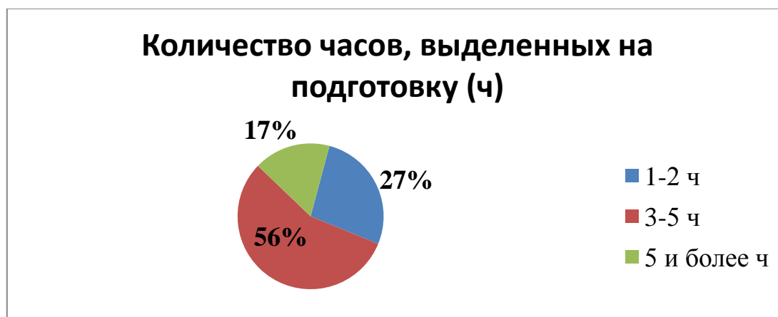
Рис. 2. Исследование времени (часов) на самоподготовку

В ходе анкетирования студентам было предложено выбрать, с чем связаны затруднения при подготовке к занятиям, вопрос имел множественный ответ. В результате опроса 79,5% опрошенных выбрали «объем материала»; 65,7% выбрали «объем письменного задания»; 32,9% выбрали «отсутствие эталона ответа для тренировочных тестов»; в 1-2% вошли такие ответы, как «неудобное расписание», «редкие лекции».