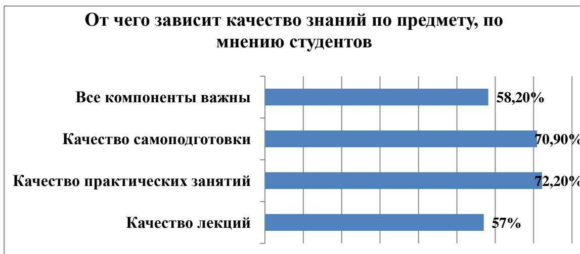
Рис. 3. Изучение факторов, влияющих на качество знаний.

При анализе анкетирования с помощью коэффициента корреляции Пирсона была выявлена положительная взаимосвязь между количеством часов, потраченных студентами на подготовку, выполнением письменных работ и успешностью сдаваемых зачетов. Результаты приведены в таблице (4).