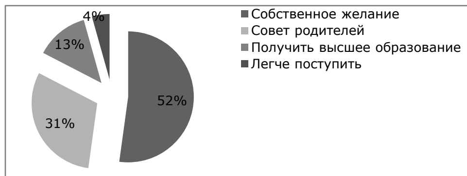
Рисунок 1. Факторы, повлиявшие на выбор профессии у студентов, жителей Екатеринбурга

Для большинства студентов - 52% из Екатеринбурга (рис.1) это желаемая профессия, только 30% из их последовали совету родителей. Некоторые студенты (13%) отметили, что это лишь стремление получить высшее образование, а 5% обучающихся решили, что в данный ВУЗ было легче поступать. На этом фоне практически все студенты (87%) из других городов Свердловской области (рис.2) поступили по собственному желанию, остальные по совету родителей. Также большинство студентов из других областей (рис.3), поступили в ВУЗ по собственному желанию - 68%, 11% обучающихся последовали совету родителей, только стремление получить высшее образование отметили 16% и лишь 5% студентов поступали с друзьями.