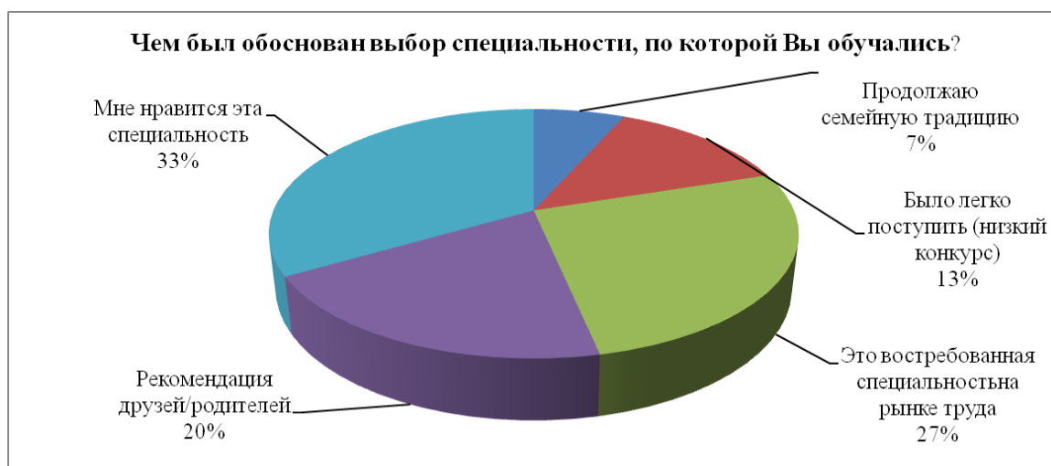
Рис.1. Обоснование выбора специальности

В результате изучения факторов влияния на выбор профессии было установлено: 33% респондентов поступали, считая специальность интересной, 26% студентов считали данную профессию престижной и востребованной на рынке труда. Пятая часть (20%) опрашиваемых решили избрать это направление в карьере, продолжив семейную традицию; 11,3% респондентов поступали на фармацевтический факультет по настоянию родителей; 13% выбрали данный факультет в связи с относительно низким конкурсом (рис.1). Полученные результаты свидетельствуют, о низкой степени информированности школьников о профессии «провизор».