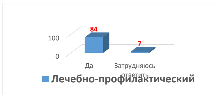
Рис. 1. Prestижно ли учиться в нашем университете?

УГМУ – отличный показатель лояльности выпускников ЛПФ (Рисунок 1). На вопрос «Интересно ли Вам было учиться?» 98% выпускников дали положительный ответ – это также является высоким показателем познавательной мотивации обучающихся.