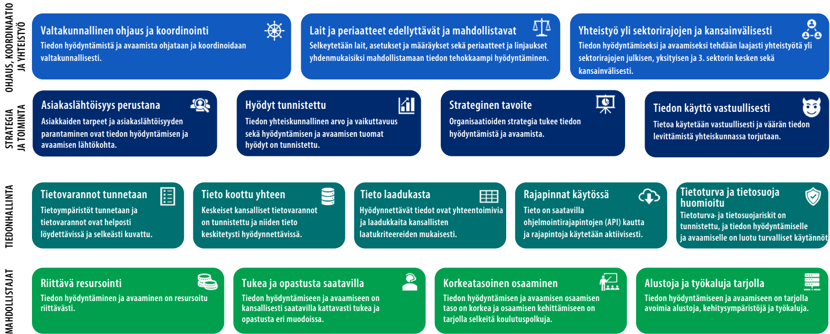
Kuva 1. Tietopolitiikan strategiset tavoitteet – kohti kattavaa tiedon hyödyntämistä ja avaamista.