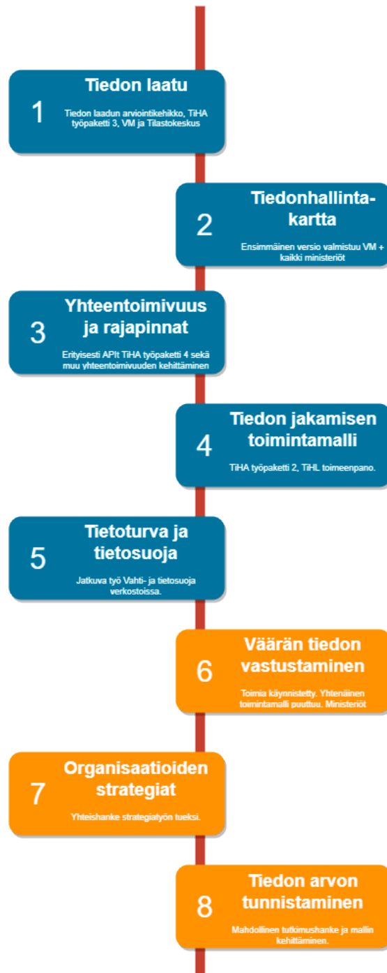
Kuva 6. Toimeenpanon aikajana.

Keltaisella merkityt hankeaihiot voitaisiin käynnistää vuonna 2023 tai sen jälkeen.