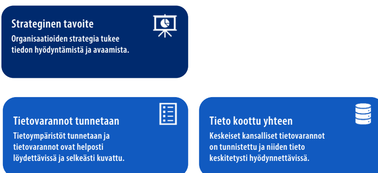
Kuva 4. Organisaation strategisen tavoitteen asettamisen edellytyksiä.

Julkisessa hallinnossa on pääsääntöisesti hyvä tilanne tietovarantojen tunnistamisessa, koska niiden rakentaminen ja osin sisältö perustuu lakiin. Sääntelyn valmistelun yhteydessä pitää tehdä vaikutusten arviointia. Näistä lähtökohdista huolimatta kokonaisuutena julkisen hallinnon tietoympäristöstä muodostuu monimutkainen kokonaisuus. Tietovarantojen sisällöt muuttuvat ajan kuluessa. Potentiaalisen hyödyn tunnistaminen vaatii syvälistä tietovarantojen tunnistamista ja niiden tulee olla helposti löydettävissä.