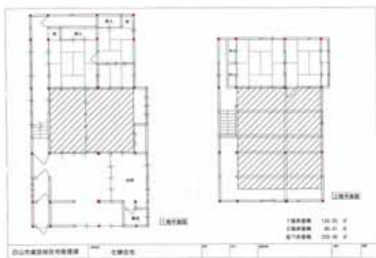
図1 白山市左礪町の倒壊家屋図面

石川県の人的被害は、死者6名、負傷者24名、住家被害は、全壊1棟、一部損壊3棟、床上・床下浸水7棟であった 2) 。