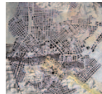
Εξώφυλλο: Φωτομοντάζ του Μ. Λεφαντζή