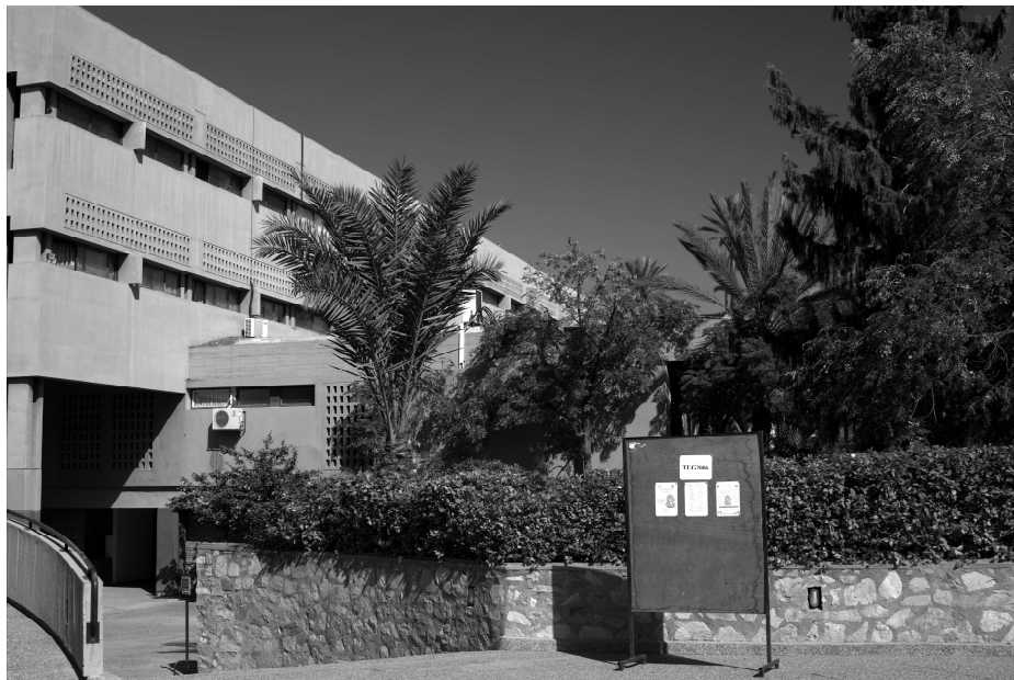
Obrázek 2: Pohled na jednu z univerzitních budov

nový český a slovenský modul pro babel nebyl oficiálním projektem \mathcal{G}\text{TUGu} , byla by jeho šance na zařazení do standardní distribuce \text{L}^{\text{A}}\text{T}_{\text{E}}\text{X} u minimální. Řada balíčků, užitečných pro Čechy a Slováky, by pak byla roztroušena po osobních webových stránkách několika aktivních \text{T}_{\text{E}}\text{X} istů a bylo by na každém uživateli, aby si s tím poradil, jak umí.