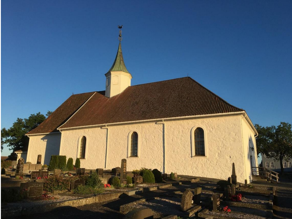
Figur 6: Tjølling kirke.

Trekirken som trolig ble reist før kirken i stein kan ha blitt bygget så tidlig som slutten av 900-tallet eller 1000-tallet (Skre, 2007b, s. 403). En av grunnene til at kirken ble reist nettopp her kan ha sammenheng med at stedet, som vi har sett, var et samlingssted i førkristen tid.