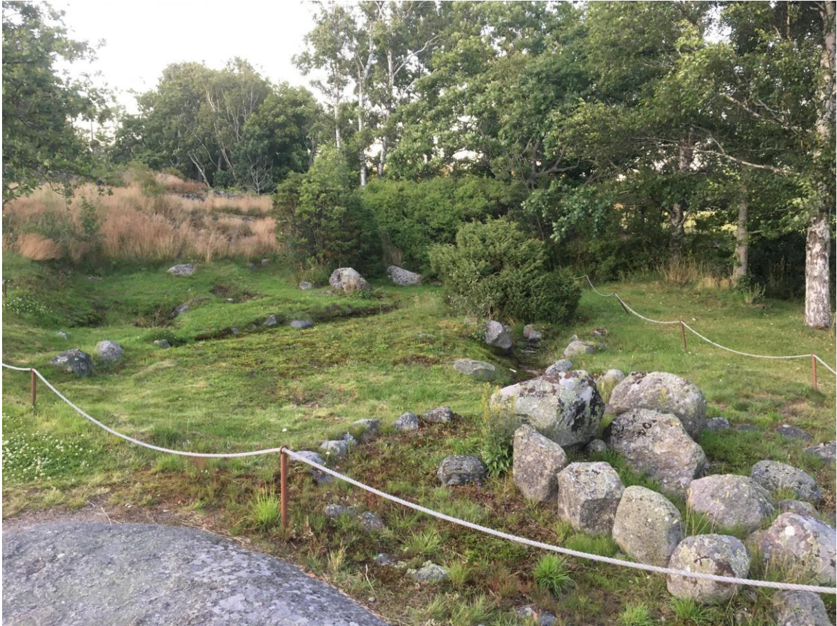
Figur 2: Graver på Kaupang.