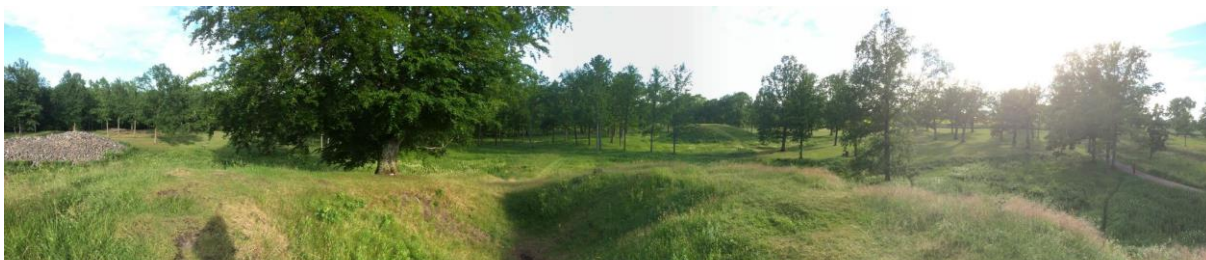
Figur 1: Noen av gravhaugene på Borre.

Borrehaugenes plassering er interessant ettersom det ved første øyekast ikke er innlysende hvorfor gravfeltet ble anlagt her. Raet er ytre Vestfolds mest dominerende landskapstrekk, det er også her vi finner flesteparten av jernalderens gravhauger (Keller, 1994, s. 95). Borrehaugene skiller seg ut ved at de ligger på yttersiden av ra-ryggen, ned mot fjorden. Dette ble dog vanligere i yngre jernalder med den økende skipstrafikken (Keller, 1994, s. 95).