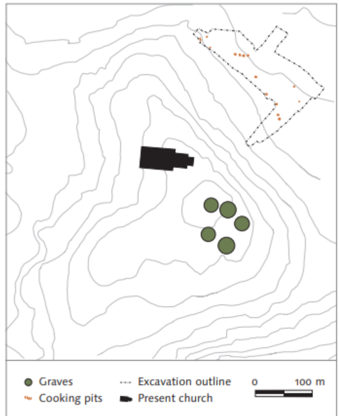
Figur 4: Oversikt over utgravning og kokegroper på Tjølling. Hentet fra Skre, 2007b, s. 399.

Tjølling kirke er en steinkirke som ble reist på 1100-tallet. Kirken ligger ca. tre kilometer fra den urbane bosetnelsen Kaupang med de omkringliggende gravfeltene som inngår i denne oppgaven, og vil få et særlig fokus her (Skullerud og Skogsfjord, 2009, s. 4). I 2003 ble det utført en utgravning ved kirken i forbindelse med utvidelse av kirkegården (Skullerud og Skogsfjord, 2009). Under utgravningen ble det funnet en samling av flere kokegroper, som vist i figur 4. Det er funnet stolpehull i nærheten av kokegrovfeltene, men disse er ikke tolket som å være del av større bygninger, heller mindre, midlertidige strukturer som for eksempel til ly (Skre, 2007b, s. 399). Slike kokegrovfelt uten tegn etter bygninger kan tyde på at disse ble brukt til spesielle måltider.