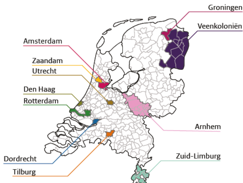
Figuur 1. Deelnemende coalities aan Lerende Lokale Monitor overleg