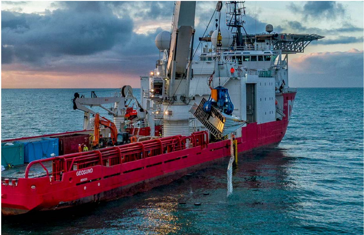
| Berging van een beschadigde container uit de Noordzeekustzone verloren door de MSC Zoe 46 .