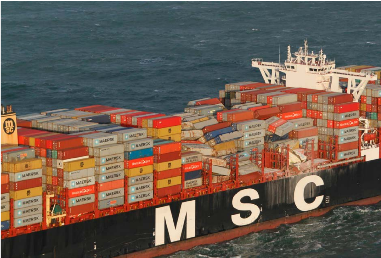
| Containers op de MSC Zoe 1 .