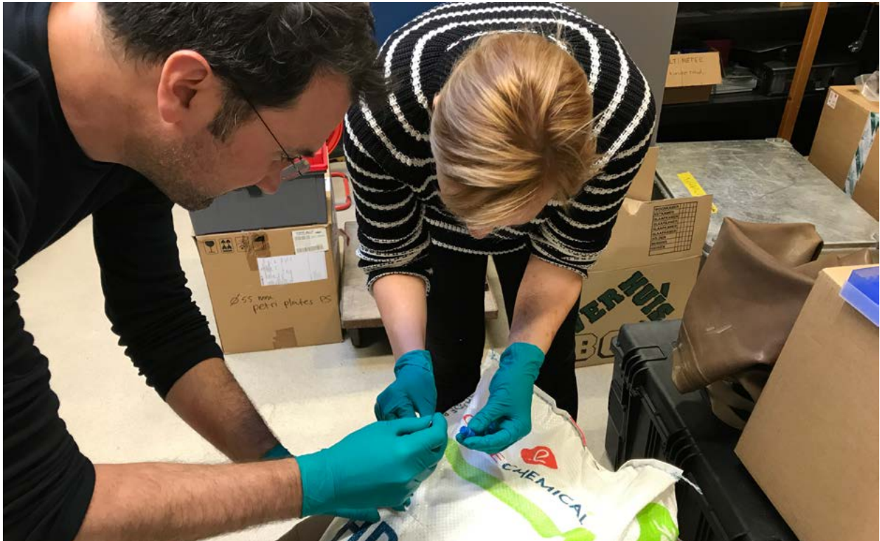
| Bemonstering van HDPE-pellets afkomstig van Schiermonnikoog op het Koninklijk NIOZ op Texel 60 .

Onderzoeksvragen hierbij zijn onder meer: