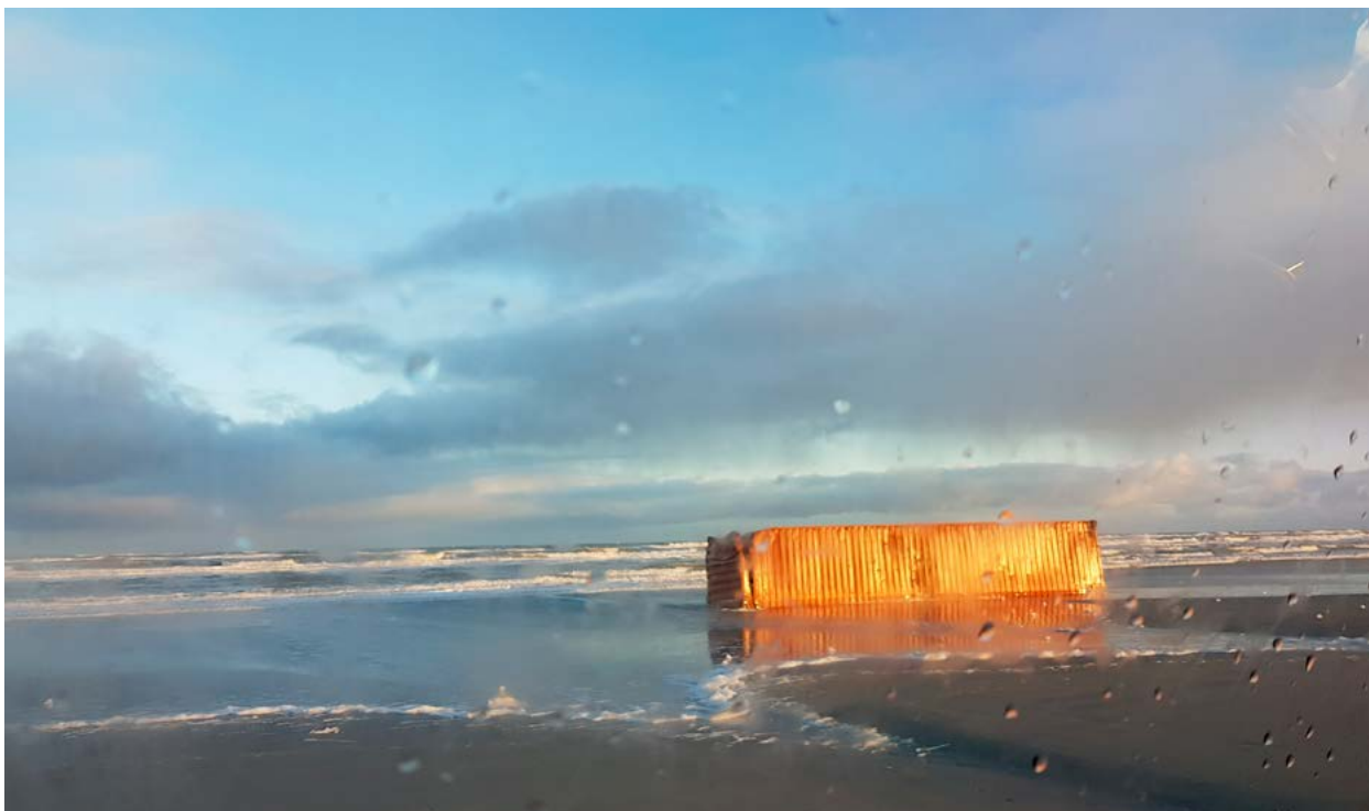
Door MSC Zoe verloren container, aangespoeld op het strand van Ameland 2 .

Het jaar 2019 was nog maar net begonnen toen de MSC Zoe een deel van haar deklading verloor net ten noorden van het Werelderfgoed Waddenzee. Al snel stroomden berichten binnen over mogelijk gevaarlijke stoffen en verschenen er foto's van stranden bezaaid met allerlei (vooral kunststof) voorwerpen zoals stoelen, jassen en speelgoed. Er werd vrij snel gestart met het opruimen en afvoeren van aangespoelde containers en losse lading en, zodra het weer het toeliet, met een inventarisatie van de containers op de zeebodem. De stranden lijken op het eerste gezicht inmiddels schoon, maar nog niet alle inhoud van de containers is geborgen. Het opruimen van de containers van de zeebodem in opdracht van de rederij kan nog enige tijd duren 3 . Met als risico dat hun lading alsnog