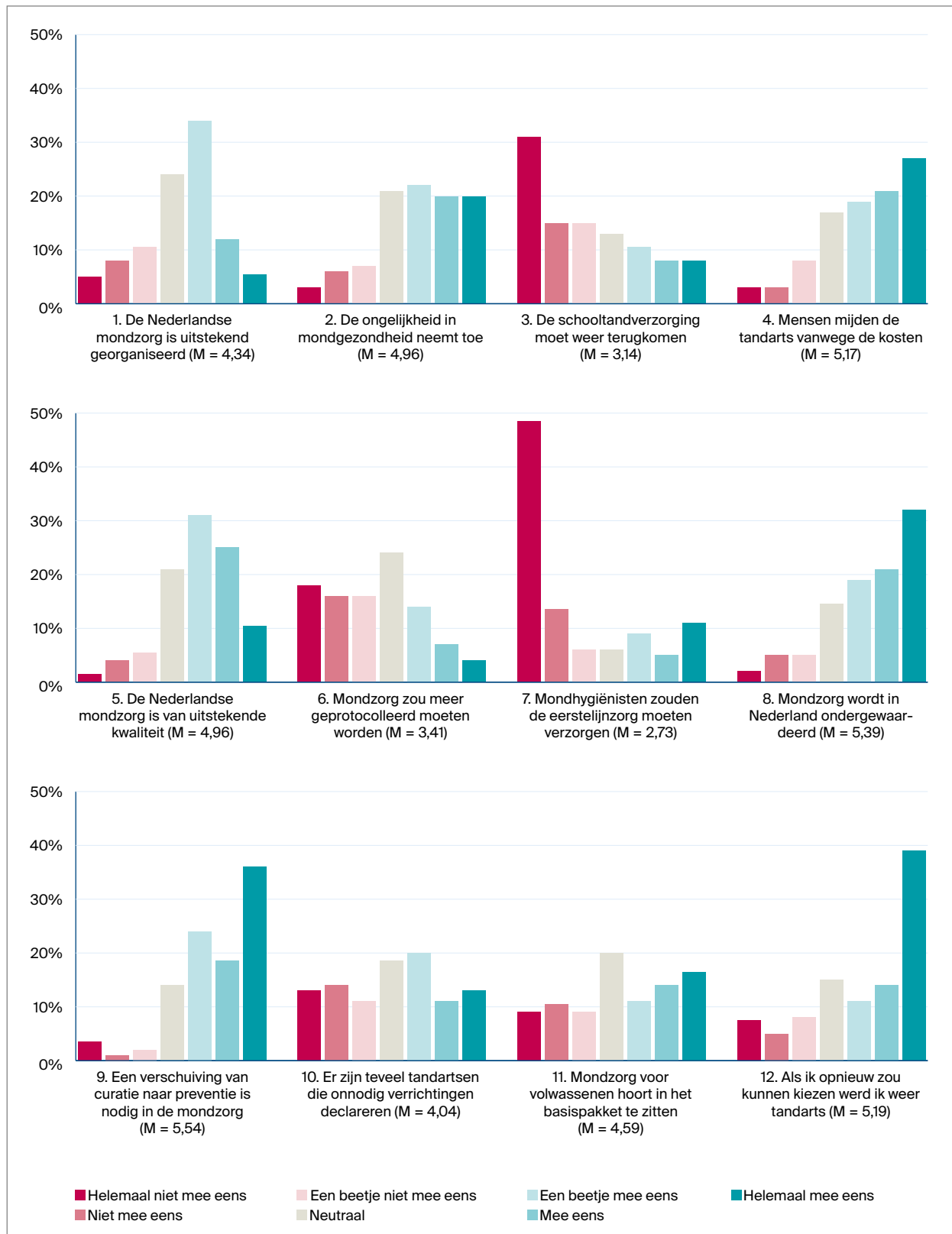
Afb. 2. Staafdiagrammen van verdeling van alle respondenten en gemiddelde scores (M 1 t/m 7: 1 = helemaal niet mee eens t/m 7 = helemaal mee eens).

preventie. Eén statistisch significant verschil tussen tandartsen en gedifferentieerde tandartsen werd gevonden. Op de stelling 'De mondzorg in Nederland is van uitstekende kwaliteit' geeft de eerste groep een hogere score dan de gedifferentieerde tandartsen, die hier vaker neutraal op antwoorden. Dit kan te maken hebben dat de laatsten vaker geconfronteerd worden met complexere problematiek als