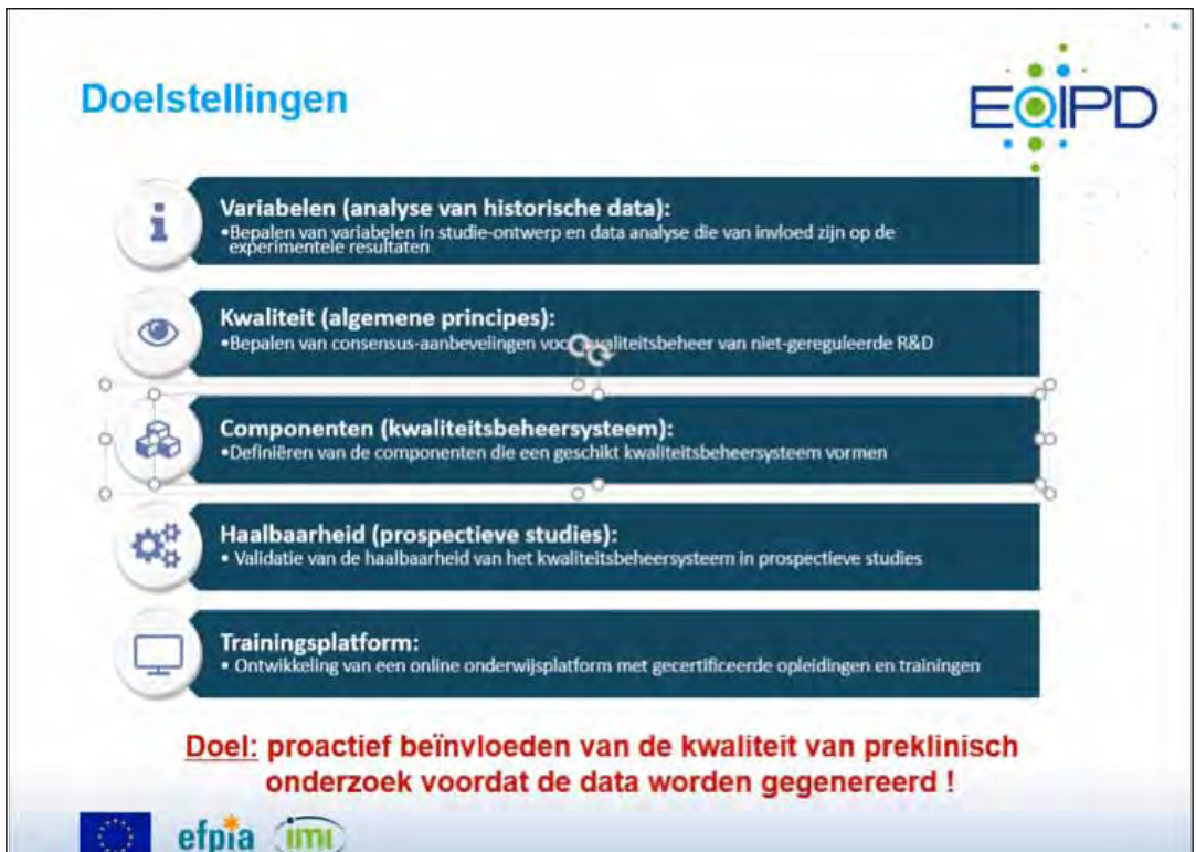
Afbeelding 1: De doelstellingen van EQIPD op hoog niveau