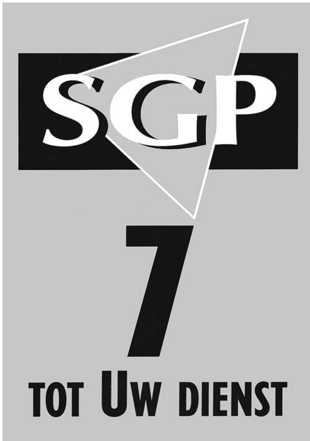
Affiche van de SGP voor de Tweede Kamerverkiezingen van 2002.

pen electoraal buiten beeld bleven. De verlokking om ook stemmen van katholieken, joden en conservatieven te trekken is echter toegenomen en zal het strak vasthouden aan gereformeerde waarheden verder kunnen temperen.