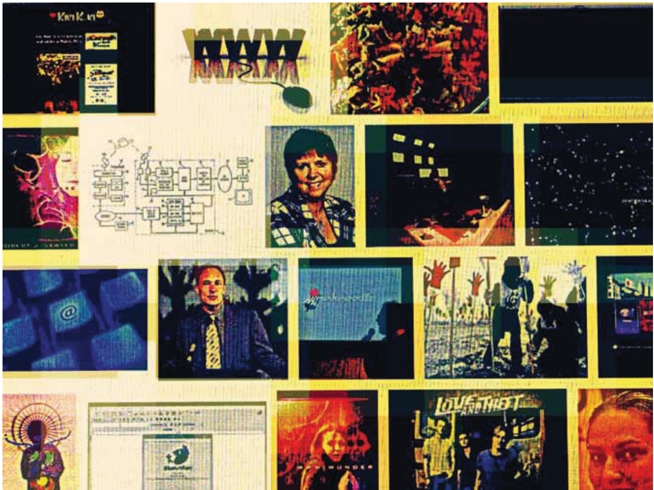
Door middel van webarchivering kunnen websites als het ware 'bevoren' worden tot een soort 'digitale prints', dit met behoud van een groot deel van de oorspronkelijke eigenschappen.

>> verleende subsidie is het DNPP overgestapt op WCT, dat zoals vermeld ook door de KB wordt gebruikt 9 . Aan dit besluit is intensief overleg met de KB voorafgegaan. Van grote invloed bij de keuze was het inzicht dat het voor een kleine instelling als het DNPP vele voordelen biedt om een grotere speler als de KB te kunnen volgen bij de technologische vernieuwingen wat betreft het downloaden, bewaren, beheren en beschikbaar stellen van gearchiveerde websites. Naast het DNPP en de KB hebben ook andere instellingen het initiatief genomen om selecties van websites te archiveren. Zo experimenteert het Nederlands Instituut voor Beeld en Geluid met het archiveren van websites van omroepen en webgebaseerde media. Ook zijn er enkele lokale initiatieven, zoals een cultuurhistorisch archief van Rotterdamse websites dat wordt bijgehouden door het Gemeentearchief Rotterdam. Al deze initiatieven zijn vooral gefocust op collectievorming (het verzamelen van verschillende websites vanuit het perspectief van erfgoed en onderzoek). Een andere vorm van webarchivering,