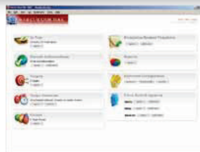
Screenshot Web Curator Tool.

Het is mogelijk om websites of webpagina's te bewaren zodat het voortbestaan niet meer afhankelijk is van een eventueel archief op de betreffende site zelf. De meest gangbare methode voor het aanleggen van zo'n webarchief wordt webharvesting of ook wel webarchivering 6 genoemd. Door middel van webharvesting kunnen websites als het ware 'bevroren' worden tot een soort van 'digitale prints', dit met behoud van een groot deel van de oorspronkelijke eigenschappen. Het is niet eenvoudig webarchivering goed uit te voeren. Alleen al het Nederlandse web is enorm groot en verandert voortdurend. Alles bewaren is dus niet mogelijk, selectie is hoe dan ook vereist. Dat creëert een lastig probleem. Een webarchief wordt in essentie meer voor de toekomstige dan voor de huidige gebruikers aangelegd. Hoe kunnen we nu weten in welke informatie toekomstige gebruikers straks het meest geïnteresseerd zijn? Bovendien is de technologie weerbarstig, zowel de technologie van het web zelf als die van de benodigde