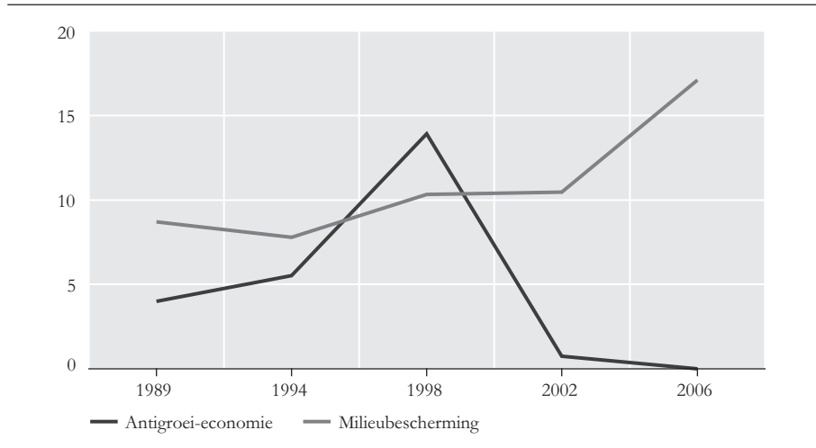
Figuur 2. Nadruk van GroenLinks op milieubescherming en antigroei-economie in verkiezingsprogramma's, 1989-2006

Op het terrein van de ecologische politiek valt de continuïteit bij GroenLinks meer op dan de verandering, als men afziet van details en van gewijzigd taalgebruik. De partij streed in 2010, net als in 1989, tegen kernenergie en voor duurzame energie, tegen de bio-industrie en voor biologische landbouw, tegen auto en