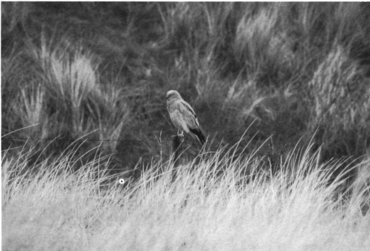
Adult mannetje Blauwe Kiekendief, één van de vele die geringd rondvliegen op de Nederlandse Waddeneilanden, Ameland. Ringed adult male Hen Harrier, Ameland.

Tijdens de incubatiefase werd de bulk van het voedsel door het mannetje aangevoerd. Er werd 16 keer een prooioverdracht waargenomen. Bij afwezigheid van het mannetje ging het vrouwtje zelf op jacht. Dit werd in vier gevallen waargenomen; ze was daarbij één keer succesvol. Bij afwezigheid van het vrouwtje ging het mannetje soms op het nest zitten. Tot 15 juni werd het mannetje veelvuldig waargenomen, daarna verbleef hij slechts sporadisch op Rottumeroog.