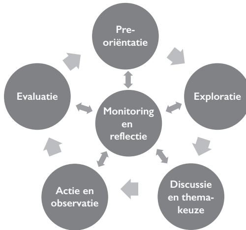
Figuur 2 Aangepaste onderzoekscyclus