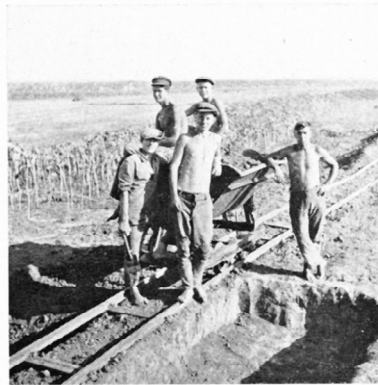
Foto 3. Met een lorie ging het sneller