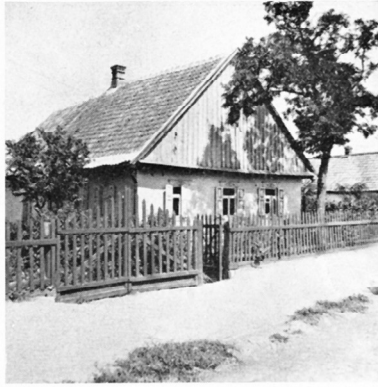
Foto 1. Onze woning in de hoofdstraat van Solonje