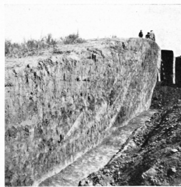
Foto 4. De verschillende heuvelgrenzen teekenen zich in den noordelijken wand van het tweede kwadrant duidelijk af

Abb. 3: Bilder von der Ausgrabung in Solone. Von links oben nach rechts unten: Wohnhaus des Ausgrabungsteams, Zwangsarbeiterinnen und -arbeiter sowie das Profil des Mogila Popova, entnommen aus BURSCH, Grafheuvelonderzoekingen bij Solonje (wie Anm. 78)