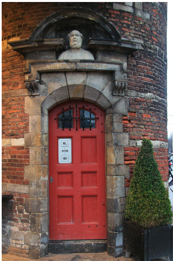
FIGUUR 2 Huidige toegangspoort in de zuidoostelijke toren van de Waag op de Nieuwmarkt, de voormalige toegang tot de gildekamer en het Theatrum Anatomicum van het Amsterdamse chirurgijngilde.

In 1864 maakte Christoffel Bisschop (1828-1904) een schilderij waarop Rembrandt te zien is die op het punt staat een deur door te gaan. Op deze deur is een skelet afgebeeld met de opschriften 'Theatrum Anatomicum', 'Collegium Chirurgicum', '1619' en 'Huc Tendimus Omnes' (figuur 5). 9 Rembrandt was een goede bekende van de Amsterdamse chirurgijns nadat hij in hun opdracht in 1632 de anatomische les van Nicolaes Tulp had geschilderd en in 1656 de anatomische les van Jan Deijman. De deur op dit schilderij heeft verschillende overeenkomsten met de toegangspoort van het Amsterdamse chirurgijngilde. We zien een gedetailleerde afbeelding van het geraamte op de deur en dezelfde begeleidende inscripties. De deur op het schilderij is echter niet dezelfde als de toegangs-