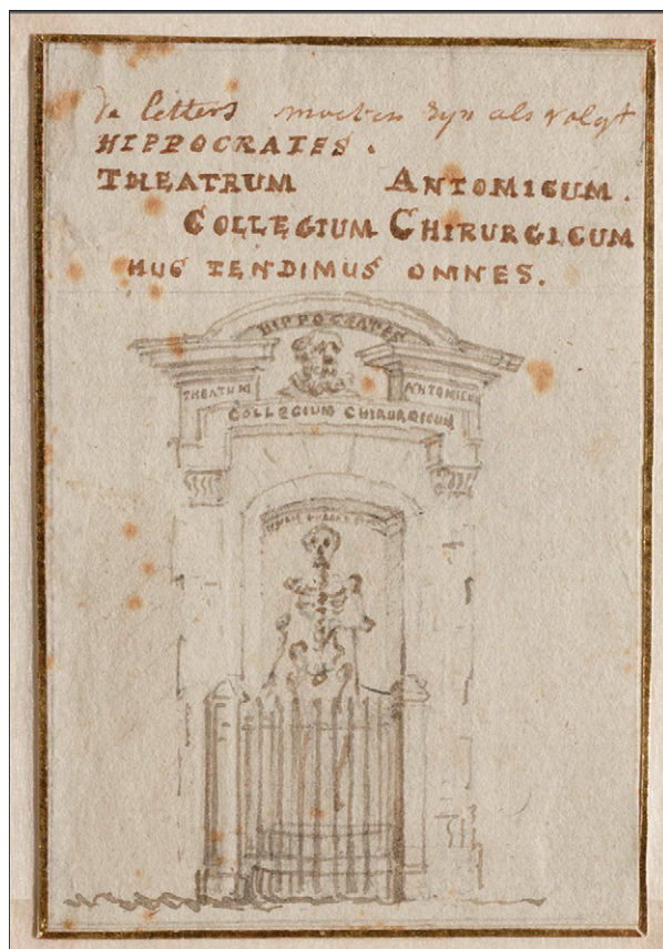
FIGUUR 3 Schets en mogelijk ontwerp van de toegangspoort van het Amsterdamse chirurgijngilde in de Waag, door een anonieme kunstenaar (ongedateerd; Stadsarchief Amsterdam).