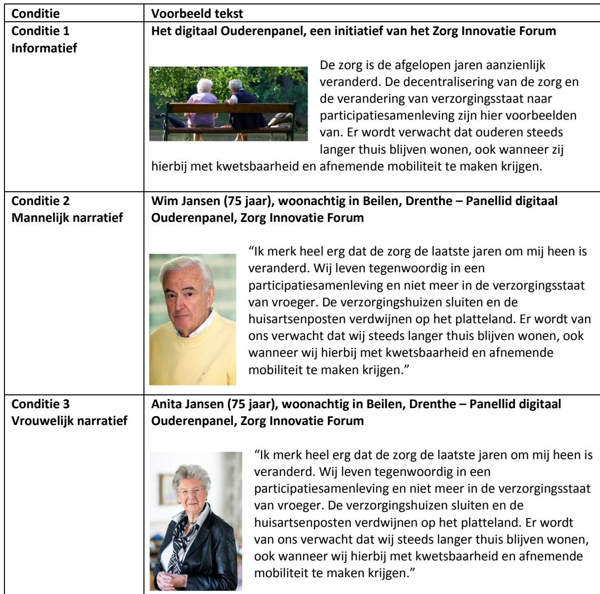
Tabel 2. Verschillen tussen de drie versies.

Er is gestreefd om de teksten inhoudelijk niet tot nauwelijks van elkaar te laten verschillen, om er zo voor te zorgen dat eventuele effecten niet aan andere zaken ontleent kunnen worden. De inhoud van de teksten is hetzelfde, alleen verschillen deze op zinsniveau. In de informatieve tekst wordt de informatie algemeen overgebracht en in de narratieven vanuit het perspectief van de verteller. Daarnaast is ook gekozen om een afbeelding toe te voegen aan de teksten, omdat dit een realistischer beeld schept. Adaval, Isbell en Wyer (2006) schrijven dat lezers de indruk over een bepaald persoon baseren op zowel verbale (tekst) als visuele (afbeeldingen) informatie. De afbeelding in de informatieve tekst betreft een neutrale foto van twee ouderen op een bankje. De afbeeldingen van de narratieve teksten betreffen een fictieve foto van de verteller. Het verschil tussen de mannelijke verteller (conditie 2) en vrouwelijke verteller (conditie 3) is dus de fictieve foto van de verteller en de kop van de tekst waar de naam van de verteller staat. Dit is voor conditie 2 Wim Jansen en voor conditie 3 Anita Jansen.