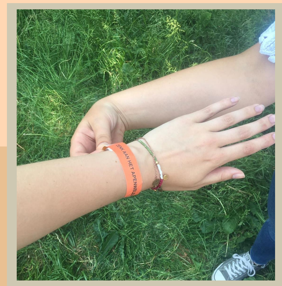
Denk om het apenwelzijn: lok de apen niet!