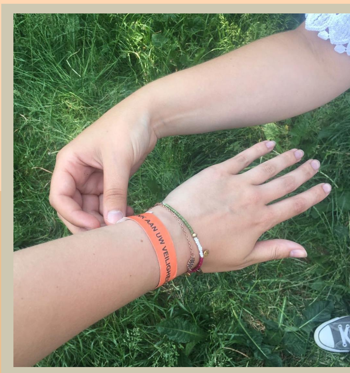
Denk om uw eigen veiligheid: lok de apen niet!