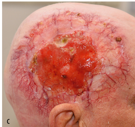
FIGUUR 2 (a) Aangezicht van patiënt B met een lokaal uitgebreid basaalcelcarcinoom van de hoofdhuid met doorgroei in het schedelbot. (b) Axiale CT-opname met 'maximum intensity projection' van de thorax met multipele nodulaire afwijkingen, die passen bij pulmonale metastasen. (c) Regressie van de hoofdhuidtumor na 9 maanden behandeling met vismodegib. (Afdrukt met toestemming van belanghebbende.)

mediane progressievrije ziekte duur was 24 maanden. 4 Bij patiënten met gemetastaseerd basaalcelcarcinoom was de effectiviteit lager. In de STEVIE-studie hadden