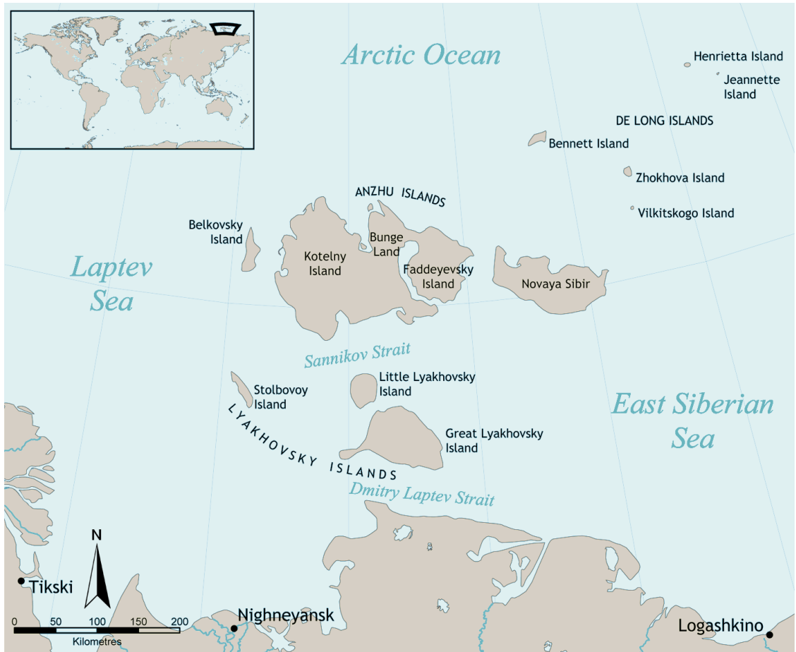
Fig. 2. De Nieuw Siberische eilanden in het noorden van Siberië.

republiek in de Russische Federatie, maakt nu dankbaar gebruik van deze natuurlijke vriezer vol ijstijdschatten.