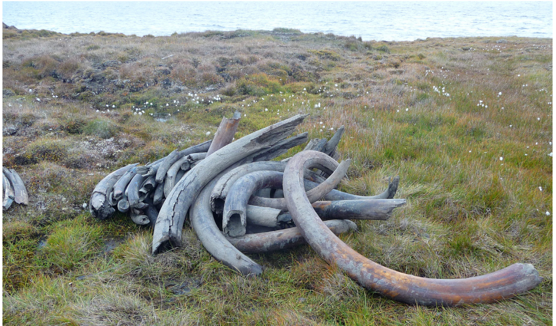
Fig. 1. Een stapel mammoet slagstanden van wisselende kwaliteit. Deze zijn binnen een tijdsbestek van enkele weken gevonden en moeten nog in folie worden ingepakt om uitdroging te voorkomen.

uiteindelijk resulterend in het uitsterven van de mammoet (Roger & Slatkin 2017: 8).