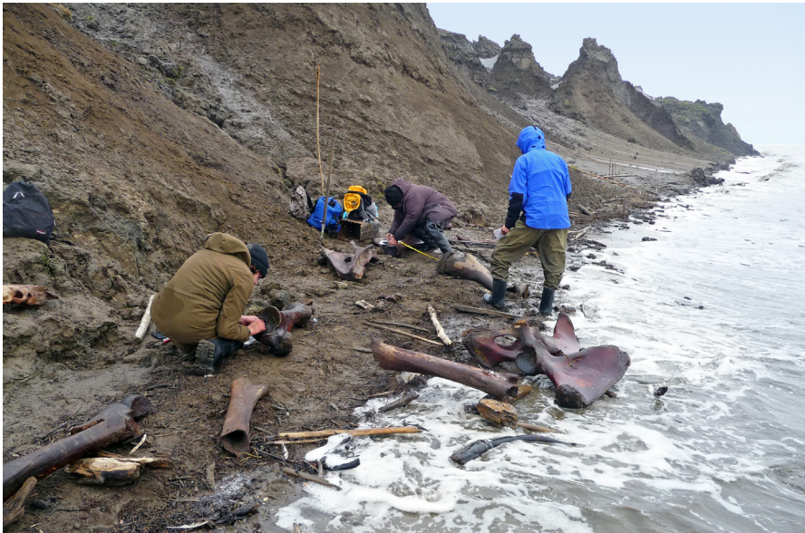
Fig. 3. Onderzoekers documenteren de botten van een mammoet onderaan permafrost kliffen op Bolshoy Lyakhovsky. Omdat het eiland slechts met kleine boten te bereiken is kan niet al het materiaal verzameld worden en zal een deel in de zee verdwijnen.