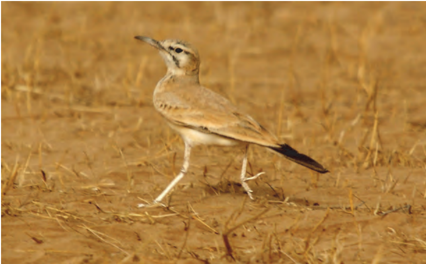
Figure 3. Alaemon alaudipes Sirli du désert, Réserve du Ndiael, 26 jan 2015.