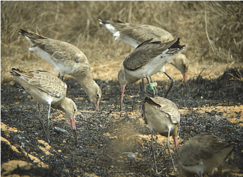
Figure 2. Barges à queue noire Limosa limosa , Technopôle de Dakar, 28 jan 2015.

Sénégal ont été dans les environs de Dakar en 1976 (Morel & Morel 1990) et à Palmarin en 1992 (Sauvage & Rodwell 1998). A propos des observations plus récentes qui suivent, il faudrait se méfier d'une possible confusion avec A. capensis , parce que les observateurs ne donnent pas assez de détails nécessaires, surtout quand il s'agit d'une observation uniquement d'un sujet en vol: un individu aux Îles de la Madeleine (Sénégal) en nov 2014 (< http://turacobirding.com/blog/ >); en Gambie (Western Region), deux observations au début de 2003 (Demey 2003, 2004a) et un sujet débusqué de la brousse à Kartong (13°5'N, 16°46'W) le 30 oct 2014 (< http://www.kartongbirdobservatory.org/index.php/news >, C. Cross & O.J.L. Fox, com. pers.).