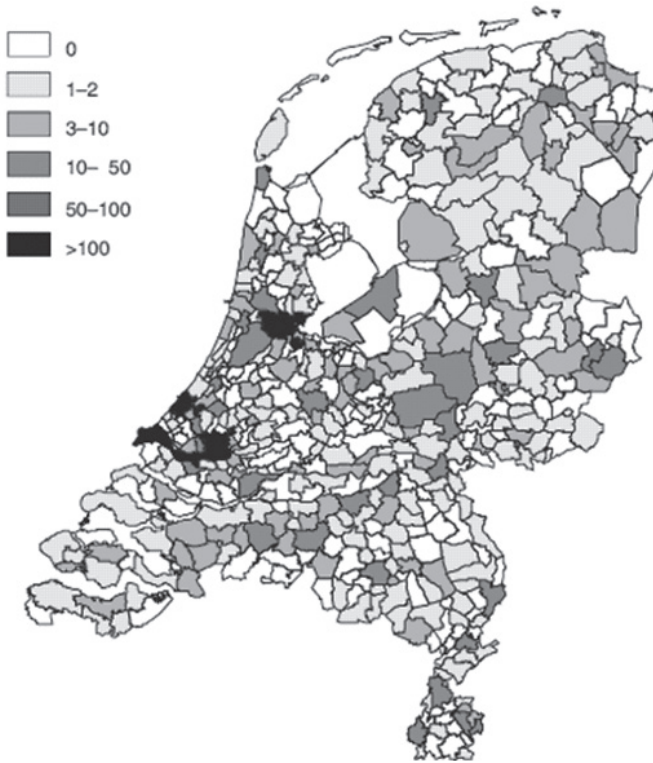
Kaart 1: Aantal moorden en doodslagen per gemeente, 1996-2003

merken (geslacht en leeftijdscombinaties) zijn in alle modellen meegenomen, 6 evenals de twee controlevariabelen op buurniveau. Bij de eerste drie modellen is telkens de indicator van een van de buurtkenmerken opgenomen, behorend bij de betreffende hypothese. In het vierde model zijn alle drie buurtkenmerkindicatoren opgenomen. Effectmaten worden weergegeven als log-odds ratio's.