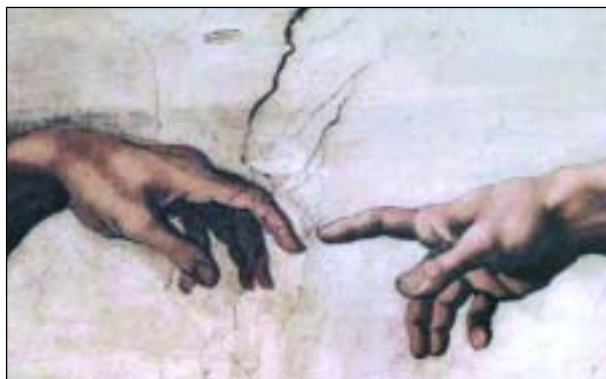
Figuur 11. Detail figuur 10.

kennis over erfelijke aanleg en de werking van onze hersenen dringen ons een deterministisch denken op. Als reactie hierop verwacht ik dat het renaissance-ideaal van de vrije wil weer populair gaat worden.