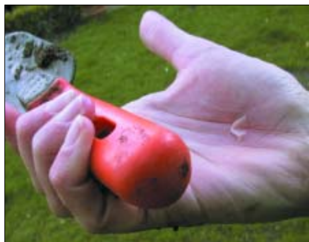
Figuur 2. Ongewilde frictieblaar in de handpalm (ongelukje).