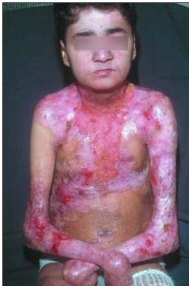
Figuur 5. Patiënt met mutilerende dystrofische epidermolysis bullosa van Hallopeau-Siemens.

Van buiten naar binnen is de huid opgebouwd uit de opperhuid met een onderste laag basale huidcellen, de basale membraan en de lederhuid met de bindweefselvezels. De huidlagen zijn goed aan elkaar verankerd. De huidcellen worden door een soort nietjes, hemidesmosomen, aan de onderliggende basale membraan vastgezet. In detail is een hemidesmosoom een soort hangbrug waar filamenten vanuit de cel op uitkomen en in het bindweefsel uitstralen. De verbindingen worden verzorgd door een keten van moleculen (figuur 4). Als één daarvan door een genetische oorzaak niet goed is aangelegd ontstaat er in meer of mindere mate fragiliteit van huid en slijmvliezen. Deze erfelijke huidziekte wordt epidermolysis bullosa, kortweg EB, genoemd. Tot nu toe zijn er 10 genen ontdekt die EB veroorzaken en kunnen er 27 klinische varianten worden onderscheiden.