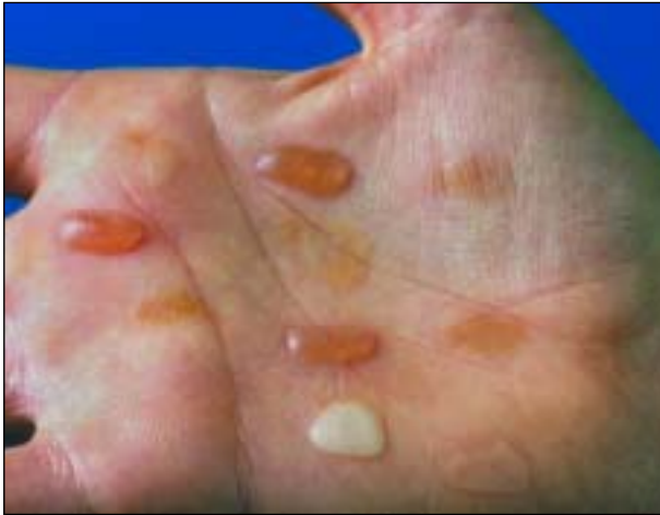
Figuur 3. Gewilde frictieblaren in de handpalm ( bulleuze dermatitis artefacta ).