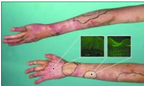
Figuur 6. Normale plekken met sterke huid op armen van patiënt met junctionele epidermolysis bullosa. Immuunfluorescentie kleuring voor BP180 toont cellulair mozaïcisme in de sterke huid, terwijl de zwakke huid geheel negatief is.

gen cellen zijn omdat ze anders na transplantatie worden afgestoten.