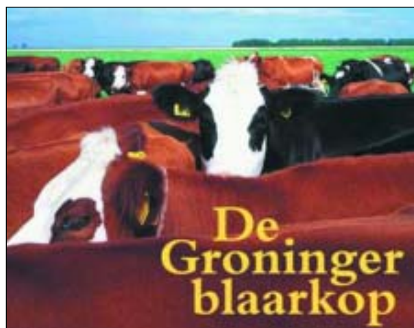
Figuur 1. De Groninger blaarkop in roodbonte en zwartbonte versie.

Normaal gesproken laten cellen pas los aan het huidoppervlak als dode huidschilfers. Levende huidcellen laten niet los, tenzij er sprake is van een pathologisch proces dat de cellen kapot maakt. Een bij ieder bekende vorm van huidloslating is die door wrijving, zoals in de handpalm na geestdriftig al te enthousiast werken met een tuinschepje (figuur 2). Het is niet zo dat frictieblaren ontstaan door de warmte van de wrijving, maar door de mechanische vervorming van het celskelet. Dit werd bijna 40 jaar geleden door Sulzberger experimenteel aangetoond met een wrijfmachine bij Amerikaanse rekruten. Je kunt je afvragen of die contacten vrijwillig liepen. Als je de huidcel maar lang genoeg heen en weer wiebelt, breken de tonofilamenten, inwendige scheerlijnen van het celskelet en verliest de cel zijn ste-