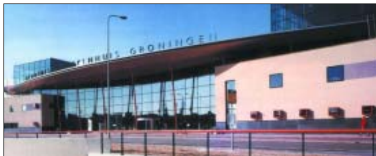
Figuur 9. De Groninger dermatologische kliniek.