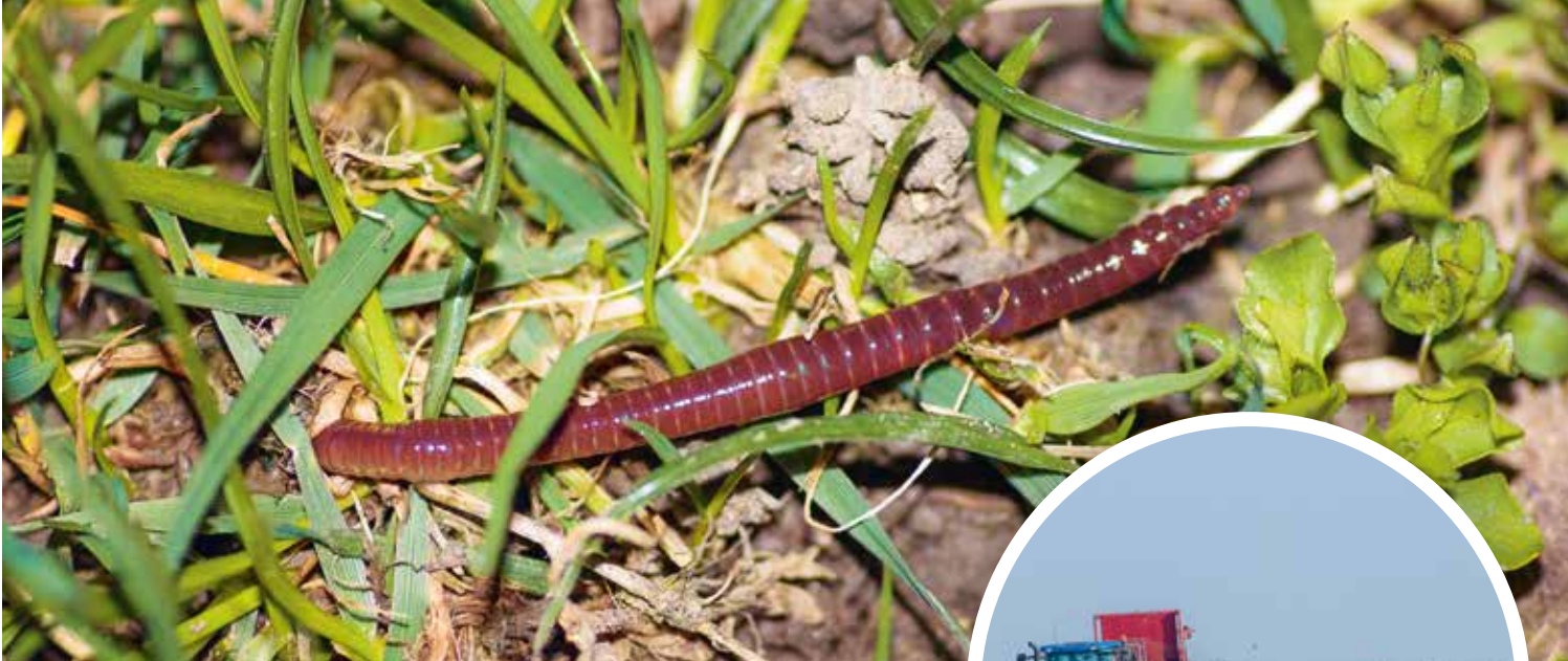
Foto 4. Een nachtelijk foeragerende rode worm. Met zijn staart verankerd in zijn holletje, zoekt hij naar grof organisch materiaal dat vervolgens de bodem in wordt getrokken om verder afgebroken te worden.