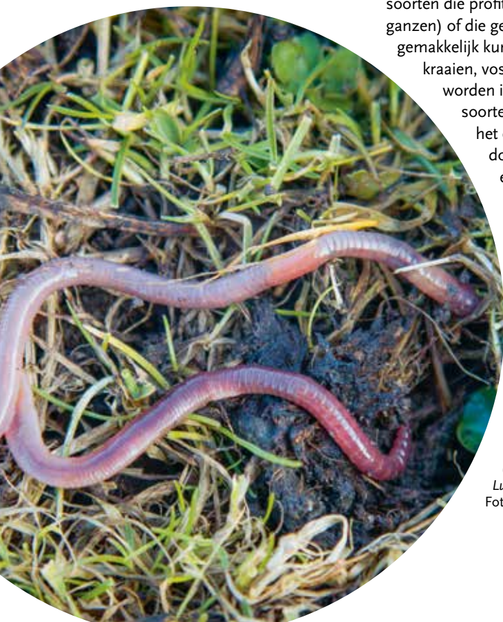
Foto 2. Een typische grijze worm Aporrectodea caliginosa (boven) en een rode worm Lumbricus rubellus .