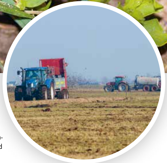
Foto 3. Links wordt ruige stalmeest uitgestrooid, rechts wordt drijfmest geïnjecteerd.